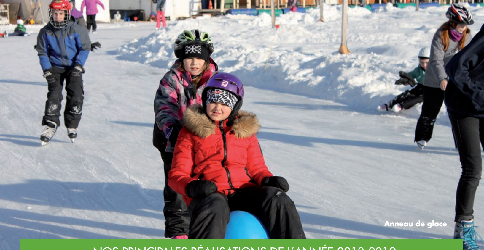
Anneau de glace