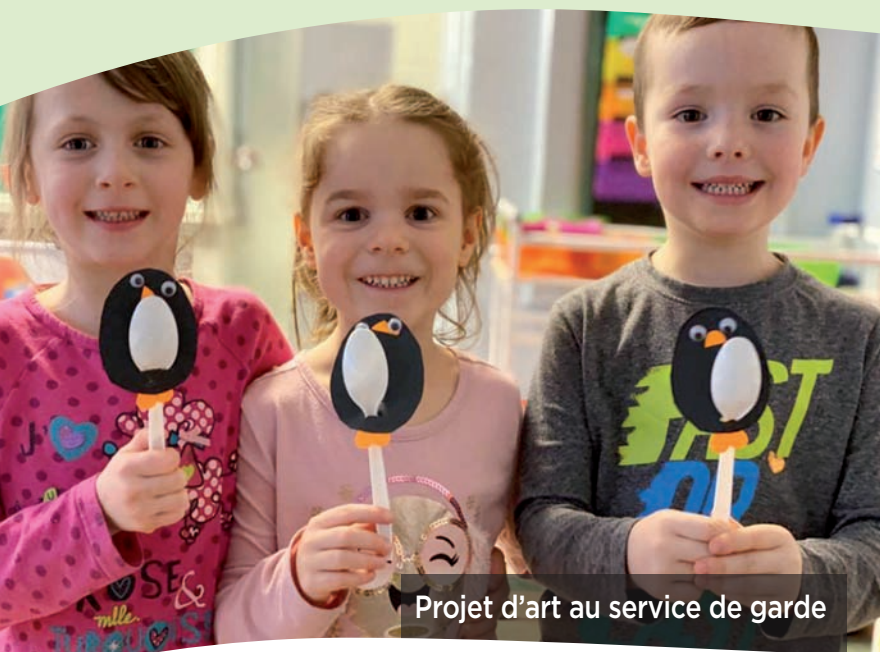
Projet d'art au service de garde