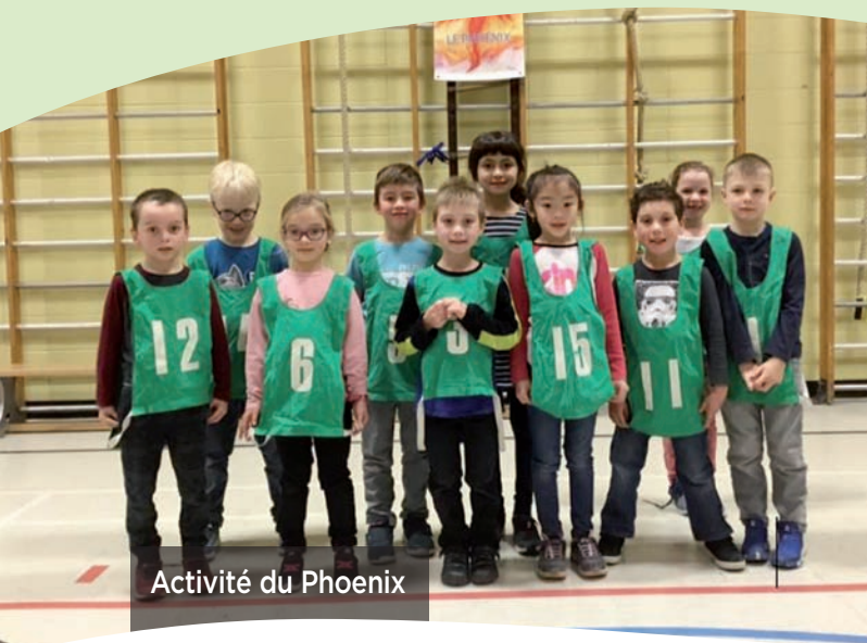
Activité du Phoenix

En raison de l'arrêt des services éducatifs et de l'enseignement causé par l'état d'urgence sanitaire lié à la pandémie de la COVID-19, le ministère de l'Éducation et de l'Enseignement supérieur a modifié le régime pédagogique. Cette modification entraîne un changement dans la communication de la progression et du rendement des élèves au bulletin unique. De ce fait, les résultats produits à l'étape 3 et au sommaire sont communiqués en mention (Réussi, Non Réussi ou Non Évalué), alors qu'aux étapes 1 et 2 l'atteinte des attentes du programme est communiquée en pourcentage. Les résultats l'année scolaire 2019-2020 ne pourront faire l'objet d'analyse ou de comparaison, étant donné les conditions entourant cette situation à caractère exceptionnel.