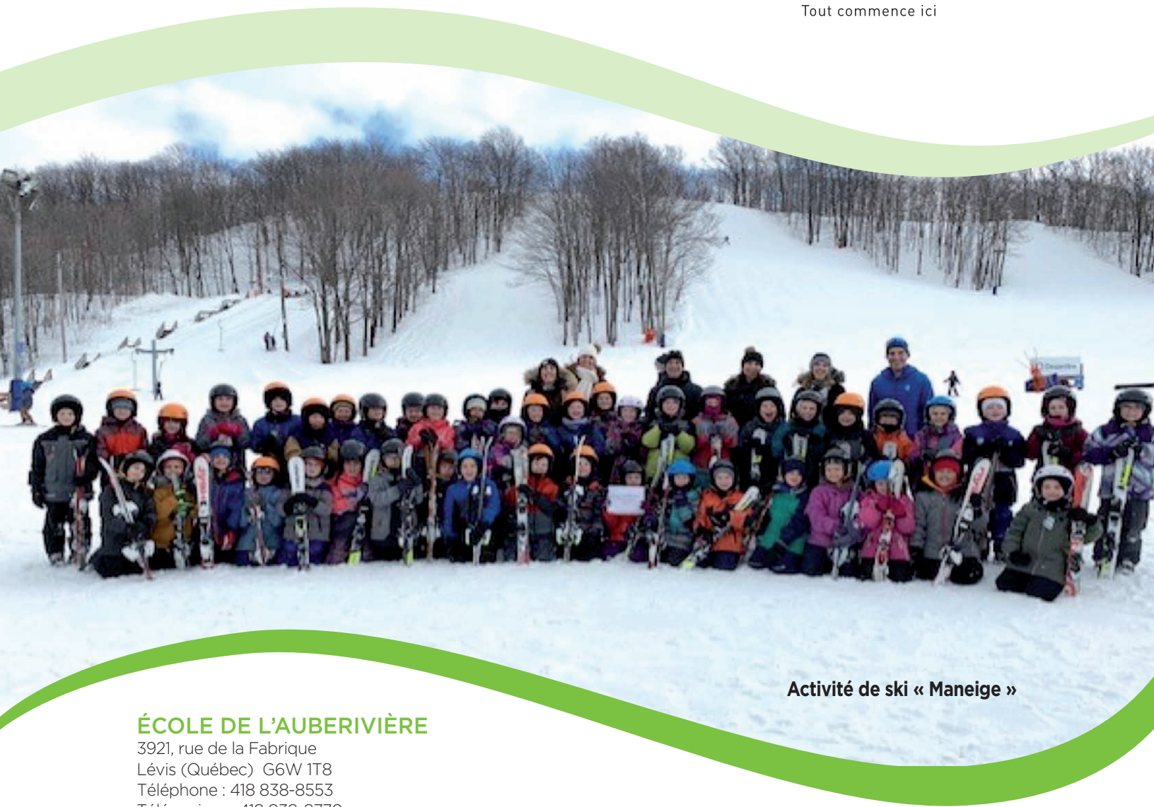
Activité de ski « Maneige »