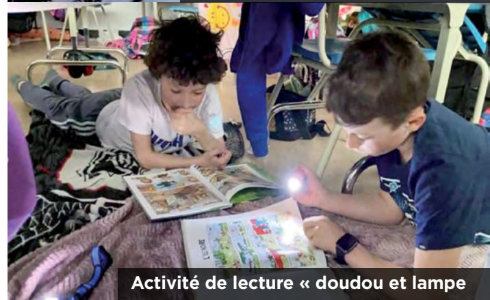
Activité de lecture « doudou et lampe »