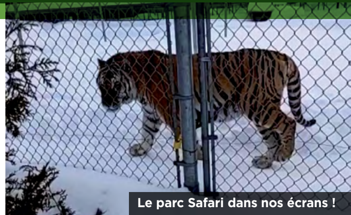
Le parc Safari dans nos écrans !