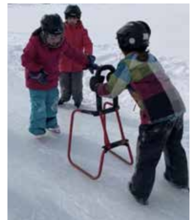
Patinage de chaque groupe-classe/ Février 2020