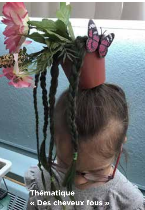
Thématique « Des cheveux fous »