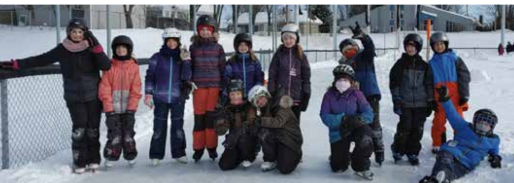
Patinage de chaque groupe-classe/ Février 2020

Centre de services scolaire des Navigateurs