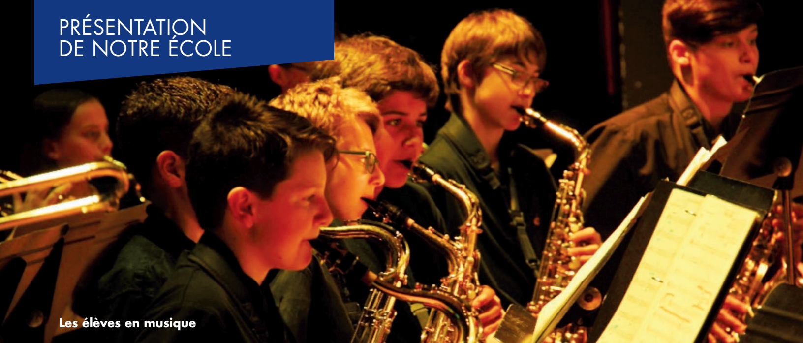
Les élèves en musique