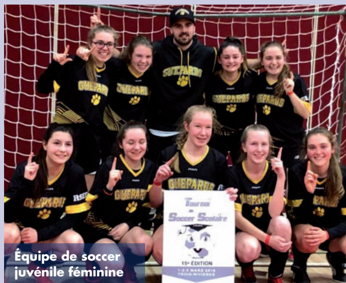
Équipe de soccer juvénile féminine