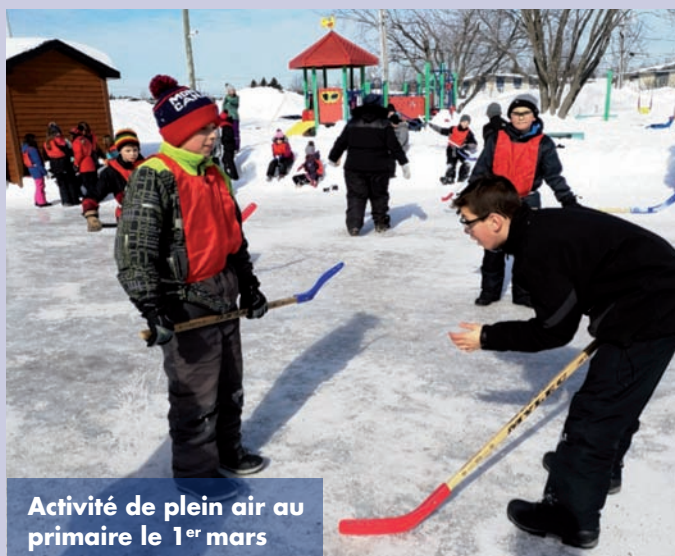
Activité de plein air au primaire le 1 er mars