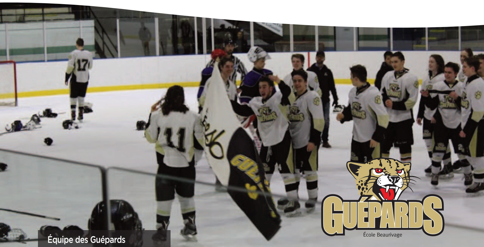
Équipe des Guépards