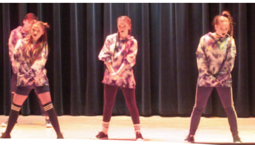
Troupe de danse