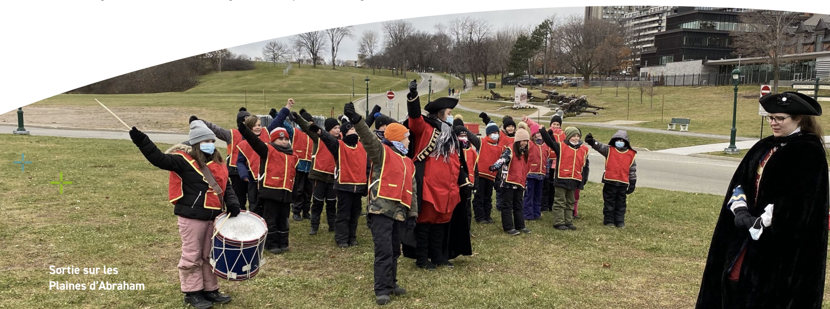
Sortie sur les Plaines d'Abraham

Nous avons également poursuivi les efforts afin de promouvoir la participation de l'ensemble des élèves à des activités physiques variées en offrant régulièrement des pauses actives supervisées, des midis sportifs, et par l'achat d'une grande variété de matériel pour les récréations. Les élèves ont également pu participer au projet Neuro-Actif. L'enseignement et le soutien aux comportements positifs se sont fait en cohérence entre tous les acteurs de l'école ce qui a permis aux élèves d'évoluer dans un milieu sain et sécuritaire. Des activités rassembleuses ont été organisées afin de souligner le respect des règles de conduite de l'école.