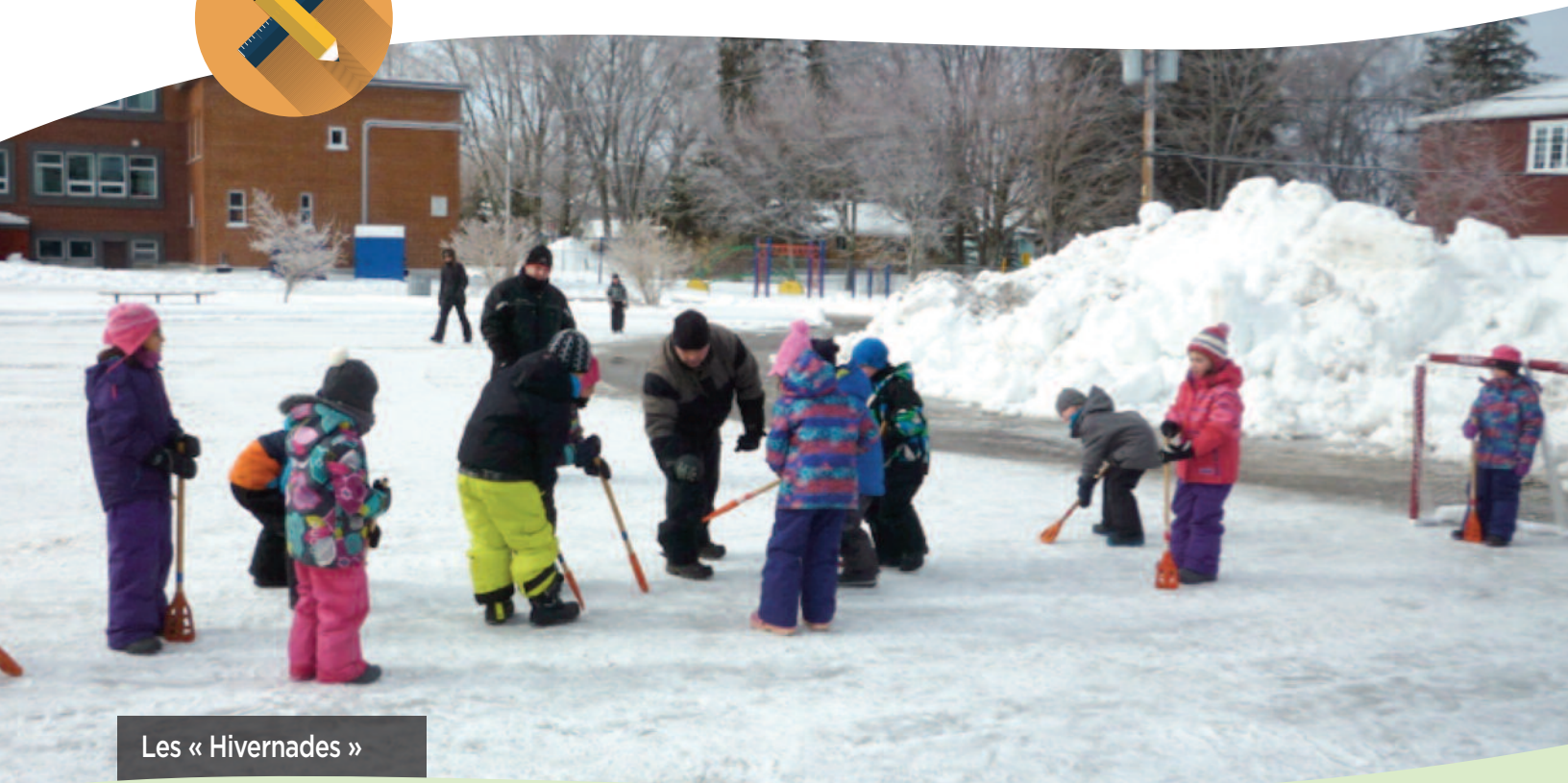
Les « Hivernades »