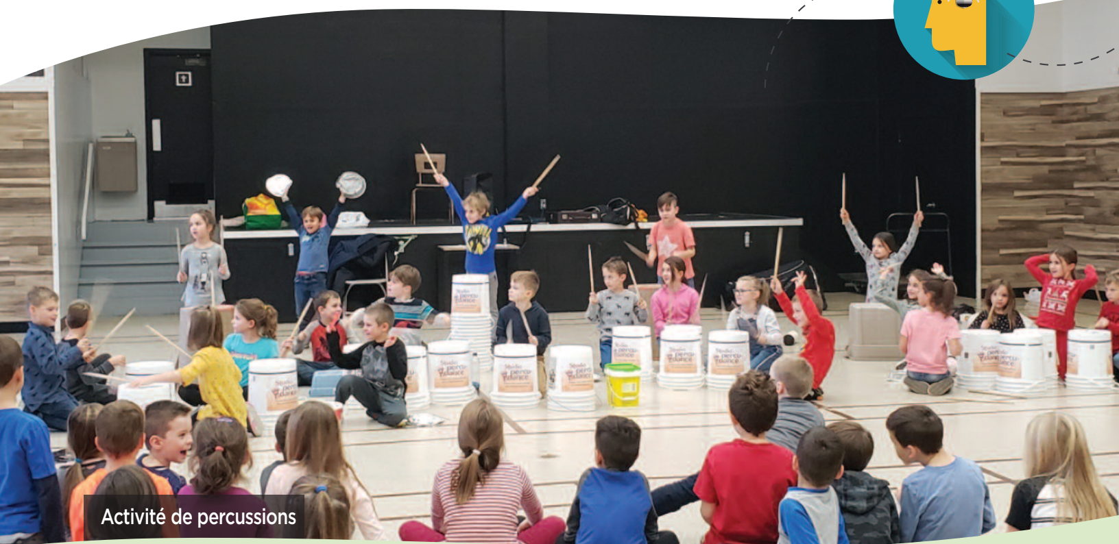
Activité de percussions