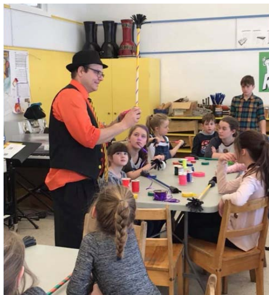
Atelier de fabrication de bâtons fleurs avec Cirqsantrik

L'équipe de titulaires stable permet d'offrir un suivi d'année en année. Le personnel dynamique se préoccupe de la réussite de tous les élèves et de toujours améliorer la qualité de l'enseignement et le bien-être de l'enfant.