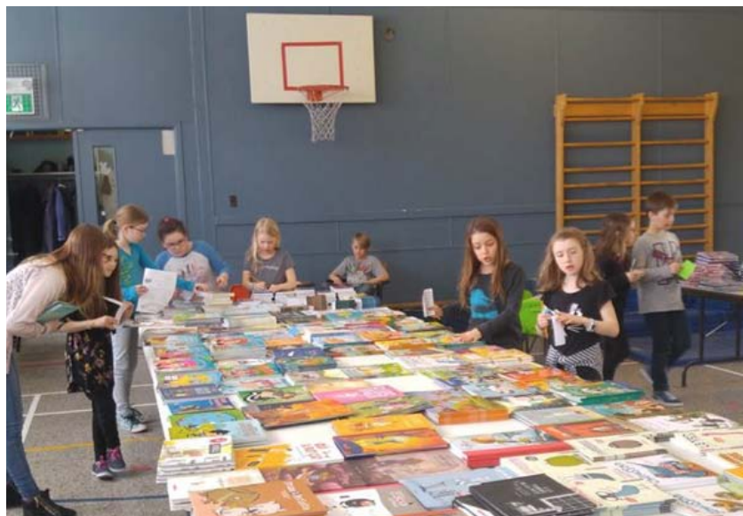
Salon du livre à l'école