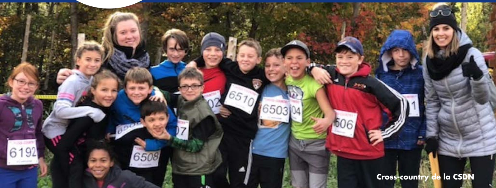
Cross-country de la CSDN