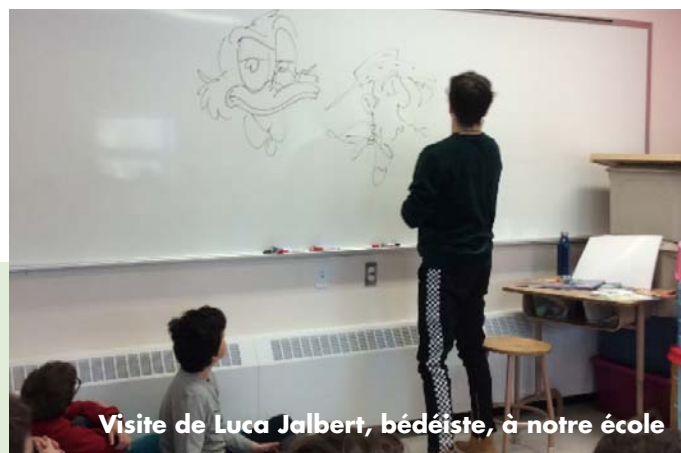
Visite de Luca Jalbert, bédéiste, à notre école

Sur les plans culturel et artistique, plusieurs activités éducatives ont été organisées par les enseignants et par le service de garde pour susciter l'intérêt des élèves envers la musique et les arts plastiques. D'ailleurs, notre concert de Noël à l'Église de Saint-Antoine-de-Tilly a de nouveau été un grand succès auprès de nos élèves, de leurs parents, mais également au sein de la communauté. Finalement, supervisés par notre enseignante de musique, plusieurs élèves ont eu la chance de former une chorale et de participer au spectacle de Gregory Charles lors des « Fêtes sur le Parvis », à Saint-Antoine-de-Tilly, le 29 juin dernier. Au service de garde, les élèves ont même pu tricoter des foulards !