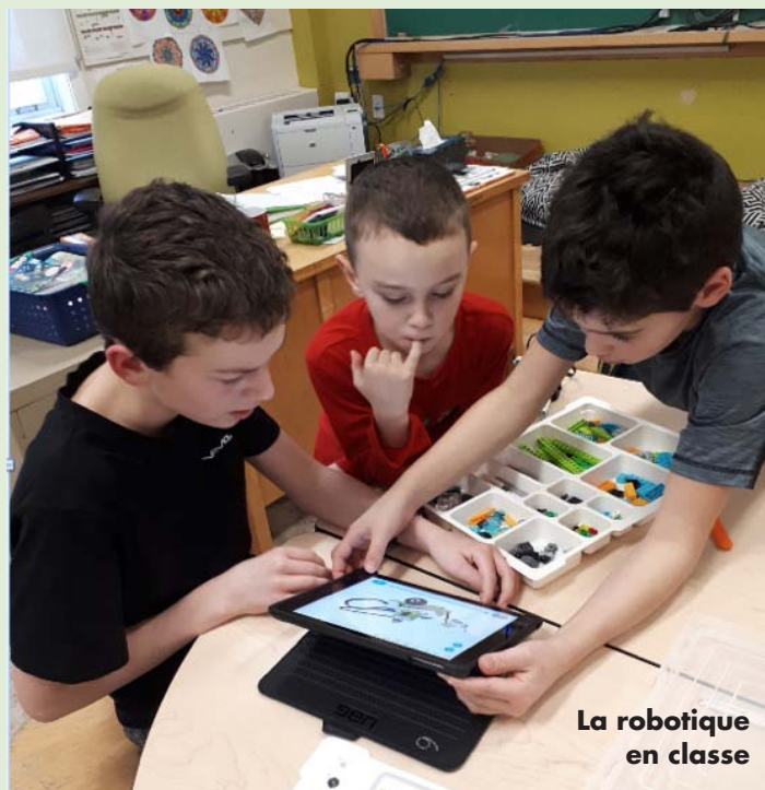
La robotique en classe