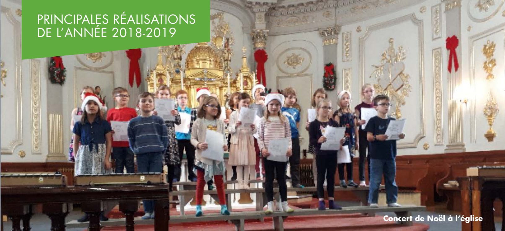
Concert de Noël à l'église

Le développement des habiletés sociales et l'importance du respect dans nos relations ont été travaillés par différentes activités en classe ou sous la supervision de l'éducatrice spécialisée. De plus, nous avons poursuivi notre système de renforcement positif, avec nos billets « Pris sur le vif ! », et ce dernier a permis aux élèves, tout au long de l'année, d'être récompensés pour leurs bonnes actions, leurs efforts particuliers, etc.