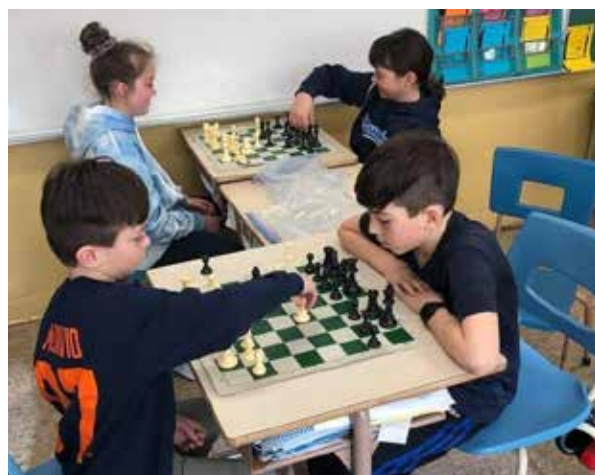
Viste de Mme Brigitte pour les échecs

Nous sommes polis et avons une attitude respectueuse en suivant les règles établies.