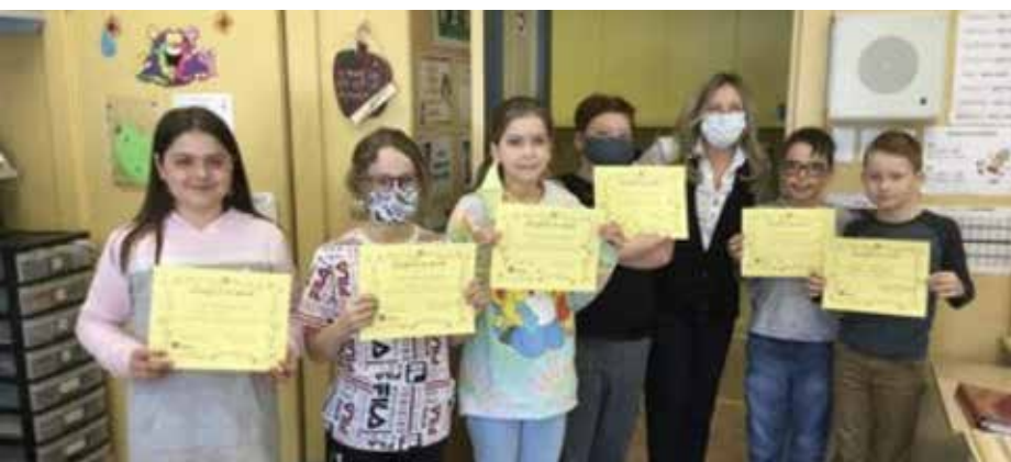
Remise des diplômes