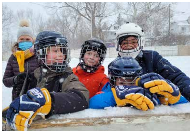
Sortie en plein air pour les 6 e année