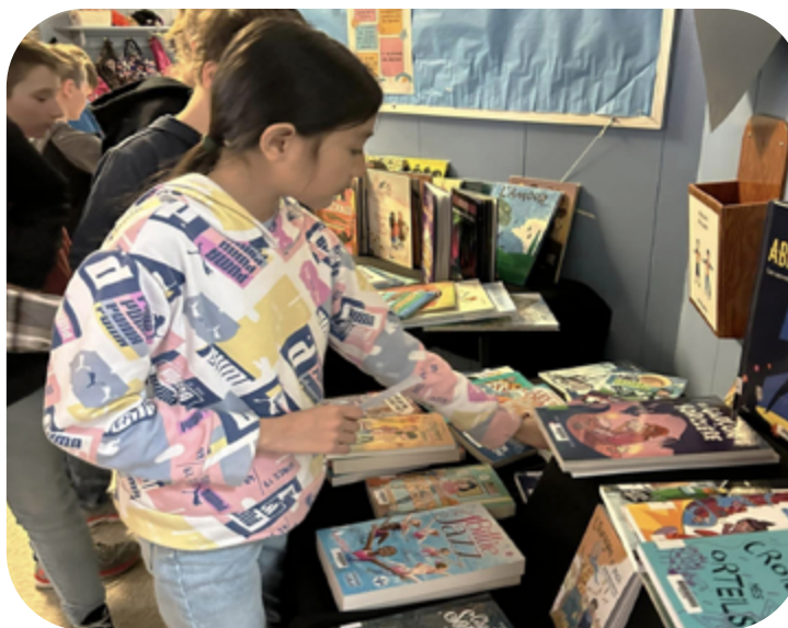
Salon du livre