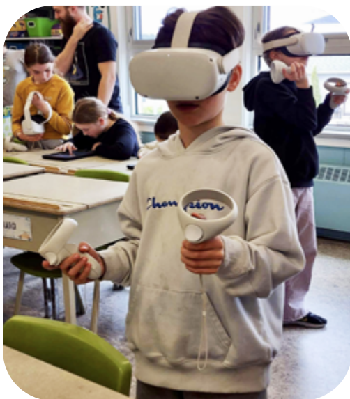
Développement des technologies au service des apprentissages