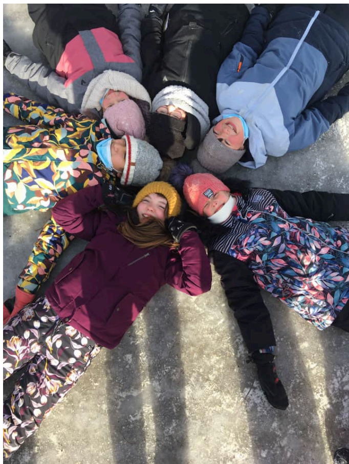
Le bonheur des élèves

Les membres de l'équipe se dévouent à faire vivre des situations d'apprentissages riches en connaissances et en innovations. Tous travaillent de concert à planifier des activités créatives, dynamiques et éducatives pour le bien-être de nos jeunes.