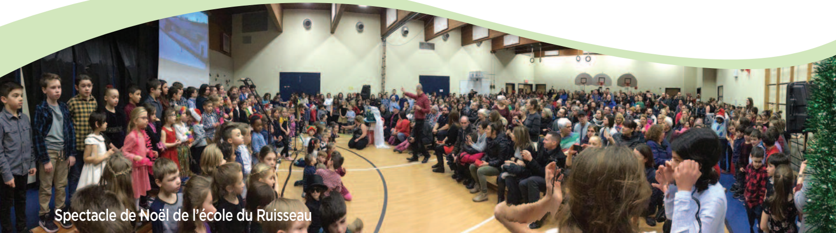
Spectacle de Noël de l'école du Ruisseau