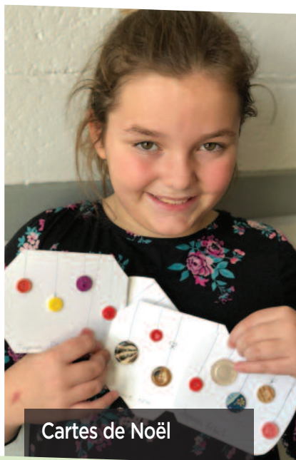
Cartes de Noël