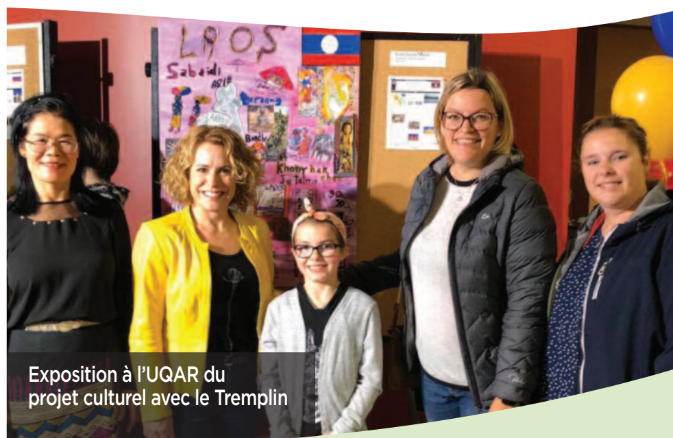
Exposition à l'UQAR du projet culturel avec le Tremplin