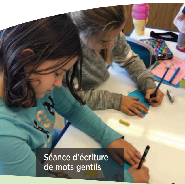
Séance d'écriture de mots gentils

L'implication de l'École du Ruisseau, Sainte-Marie dans sa communauté a pris tout son sens par la réalisation de cartes de souhaits pour les patients de gériatrie de l'Hôtel-Dieu de Lévis, la participation à un projet d'art et de culture avec l'organisme le Tremplin, la fabrication d'un sapin avec des boîtes de jus recyclé, etc.