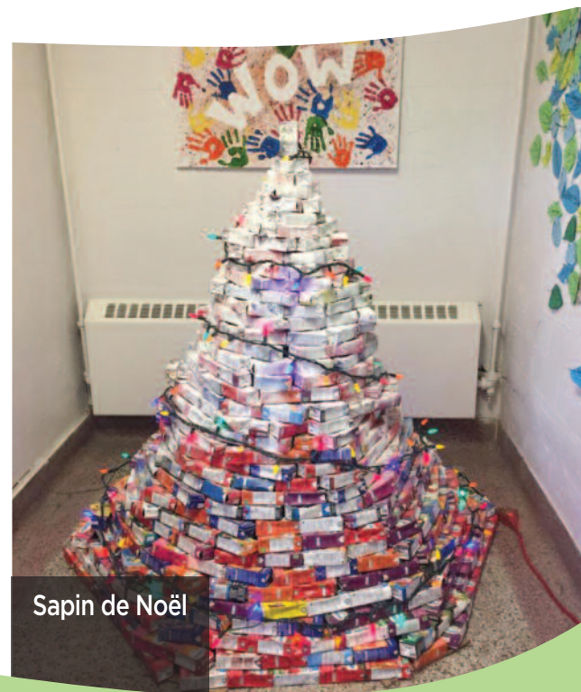
Sapin de Noël