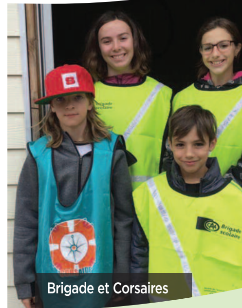
Brigade et Corsaires