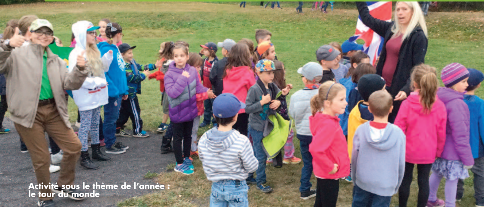
Activité sous le thème de l'année : le tour du monde