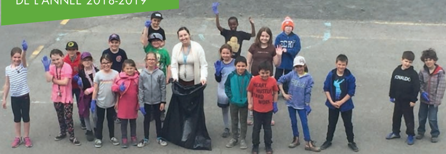
Les élèves de 2 e et 3 e année ont à cœur leur environnement et nettoient la cour de l'école !

D'autre part, les enseignants ont poursuivi le développement de leur formation continue en participant aux projets Voile, Base 10, CAP en écriture et CAP sans papier ni crayon. L'équipe d'enseignants du préscolaire et 1 re année a utilisé la planète des Alphas pour l'apprentissage de la lecture et a également mis en application les connaissances acquises lors de la formation en ergothérapie pour travailler avec les enfants du préscolaire. S'ajoute à cela l'utilisation, par les enseignantes de 1 re année, du coffret d'évaluation en lecture GB+ qui permet de cibler de façon explicite les besoins des élèves afin d'intervenir efficacement auprès de ceux-ci par la suite. De plus, des sous-groupes d'élèves du préscolaire et du 1 er cycle ont pu bénéficier d'ateliers portant sur la conscience phonologique à l'aide de l'orthophoniste et d'une TES langage. Plusieurs bénéficiaires ont été soulignés grâce à cet ajout de service auprès de nos élèves en difficulté.