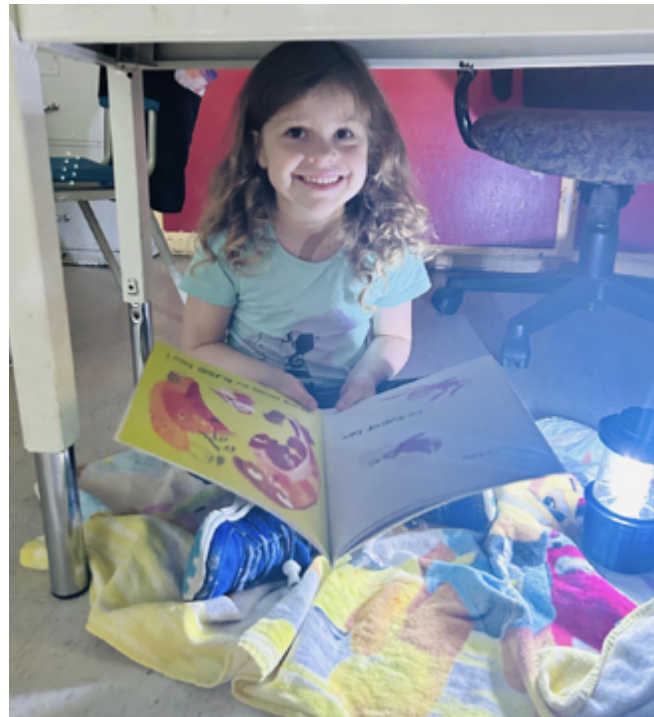
Favoriser la lecture