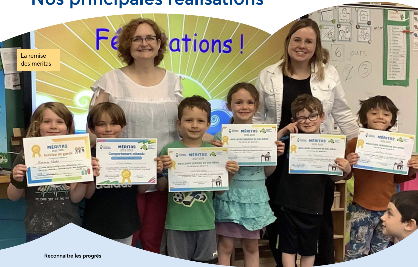
Reconnaitre les progrès

En collaboration avec l'équipe-école, nous avons continué la mise en œuvre de notre plan de lutte contre la violence et l'intimidation. Ainsi, les élèves de l'École du Ruisseau, Sainte-Marie ont vécu des activités de sensibilisation à l'intimidation dans les classes, en collaboration avec les techniciennes en éducation spécialisée. La mise en place de différents moyens, dont la création de la brigade des Corsaires, les ateliers d'habiletés sociales et l'enseignement explicite des comportements attendus s'avèrent de belles preuves de l'application de ce plan. Nous avons aussi continué un projet sur le développement des apprentissages socioémotionnels en ciblant deux compétences : la connaissance de soi et l'autorégulation.