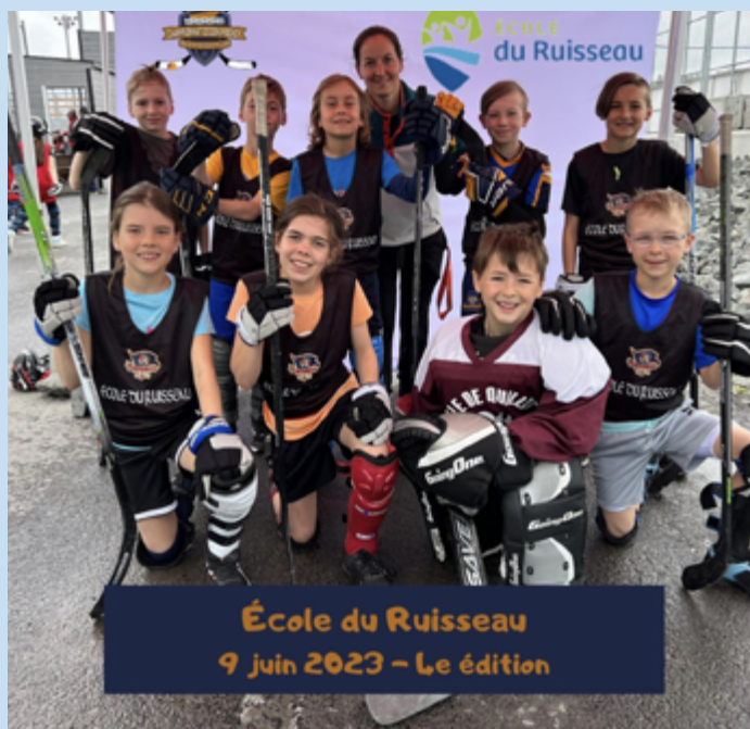
Tournoi de dekhockey

Cette année, sur le plan communautaire, l'implication de l'École du Ruisseau, Sainte-Marie s'est déployée, entre autres, par la réalisation de messages pour les personnes âgées et par le ménage du boisé près de l'École du Ruisseau. Nous avons également poursuivi un partenariat avec le Club Rotary de Lévis qui nous a permis d'aider, de différentes manières, des familles de nos milieux dans le besoin.