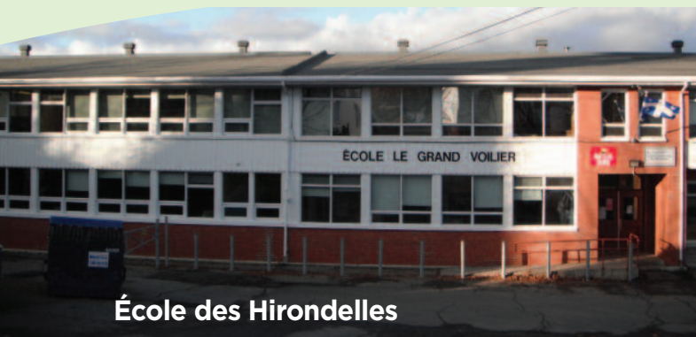
École des Hirondelles

Sise au cœur du village de Saint-Nicolas et bercée par le fleuve Saint-Laurent, l'École du Grand-Voilier accueille environ 460 élèves du préscolaire à la 5 e année. L'École de l'Envol reçoit les élèves lors de la 6 e année. Les élèves de la maternelle, 1 re et 2 e sont habituellement regroupés à l'École des Hirondelles et les autres niveaux fréquentent l'École du Saint-Laurent. En plus des services pédagogiques et complémentaires, les élèves peuvent bénéficier d'un service de garde dynamique et bien structuré.