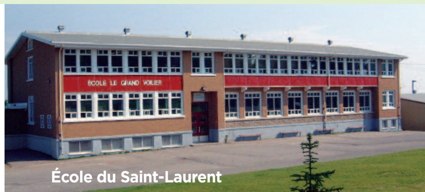
École du Saint-Laurent