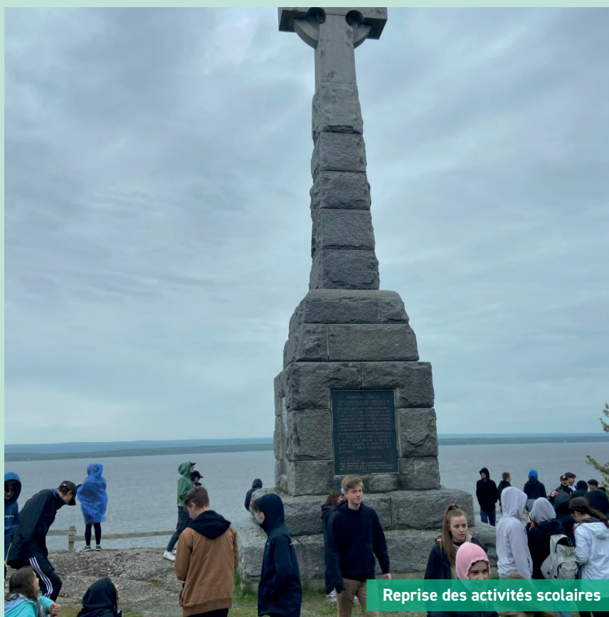
Reprise des activités scolaires