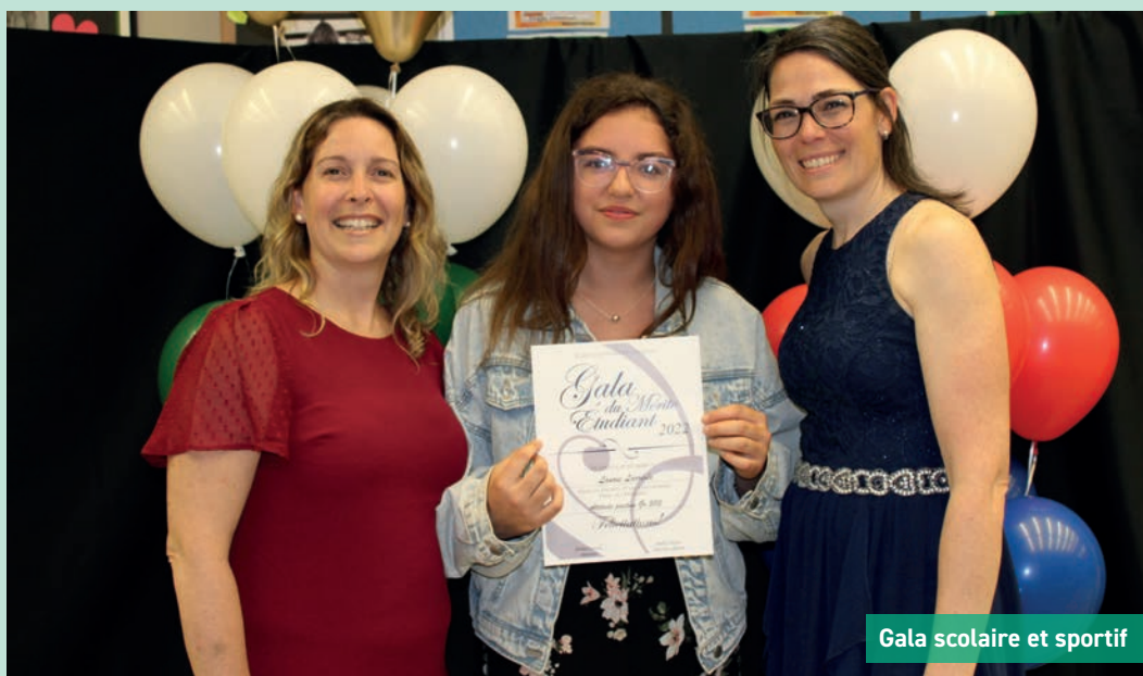
Gala scolaire et sportif