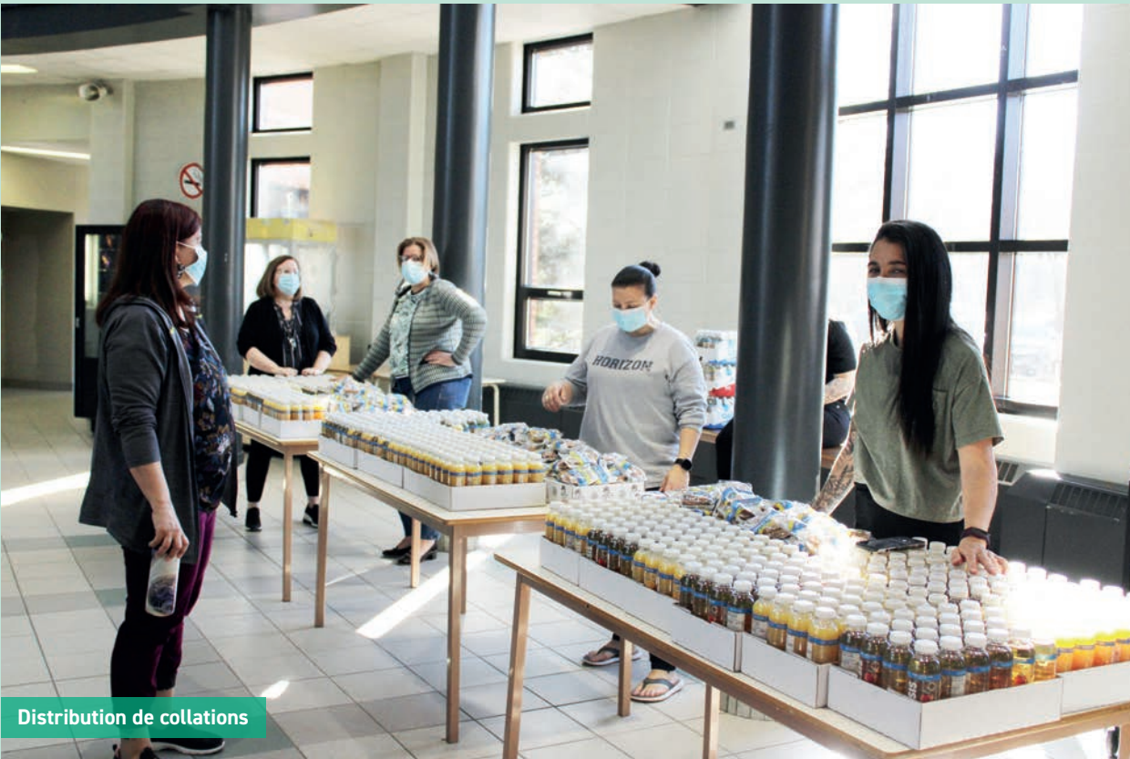
Distribution de collations