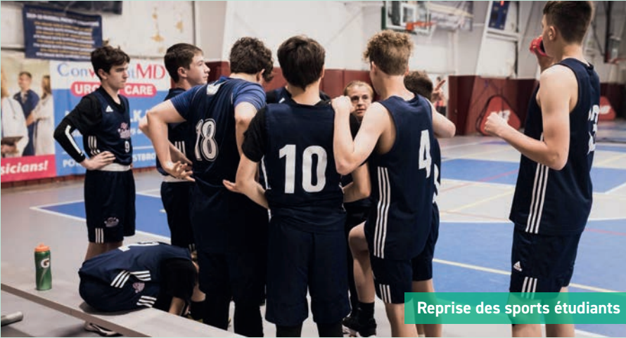
Reprise des sports étudiants