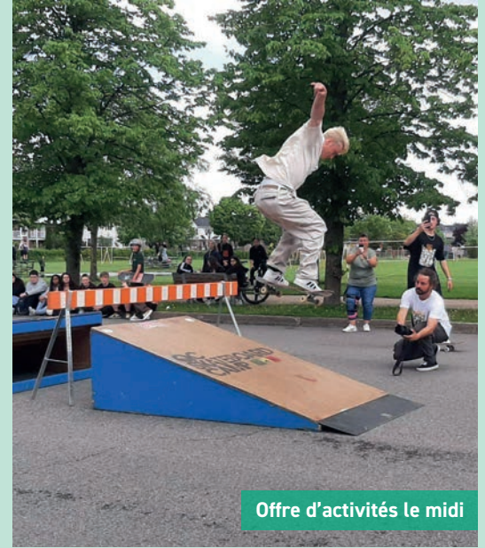
Offre d'activités le midi