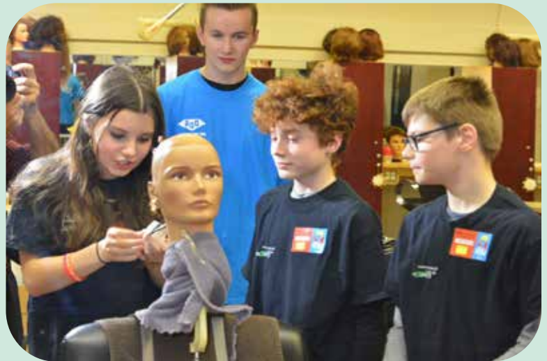
Défis des recrues