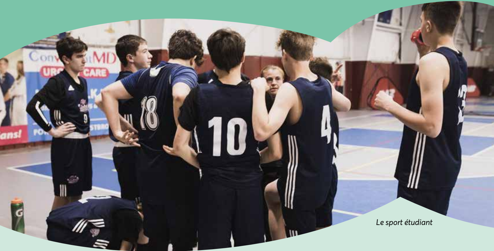
Le sport étudiant