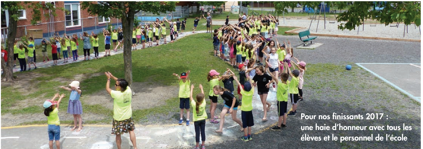
Pour nos finissants 2017 : une haie d'honneur avec tous les élèves et le personnel de l'école