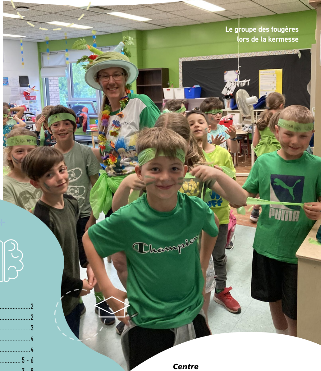
Le groupe des fougères lors de la kermesse