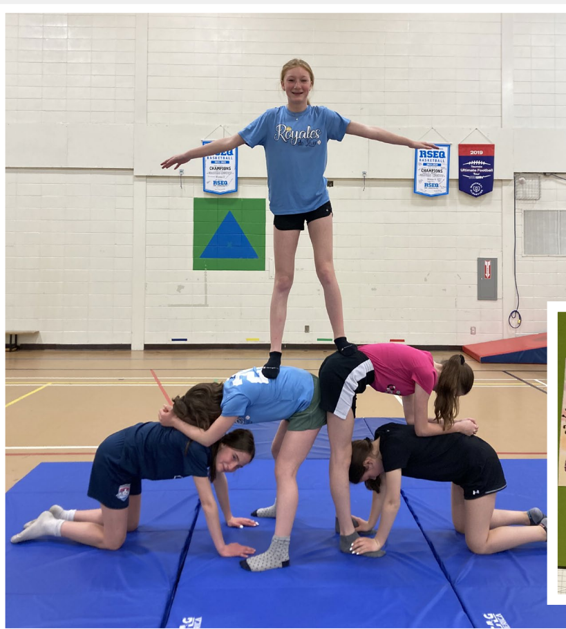
Des filles bien fières de leurs prouesses en gymnastique !