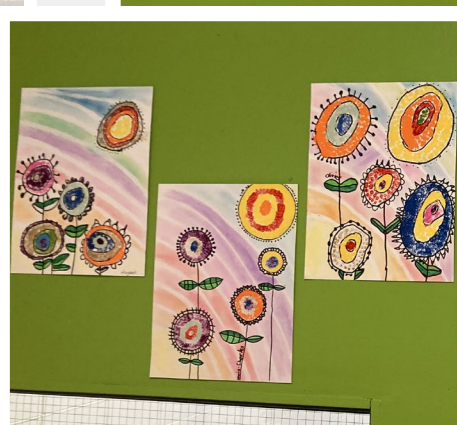
Quelques œuvres de nos artistes !