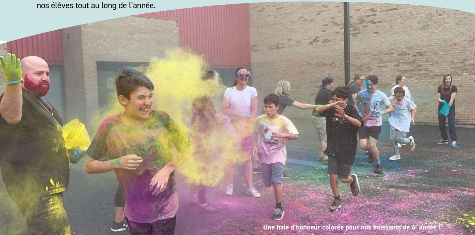
Une haie d'honneur colorée pour nos finissants de 6 e année !

Toutes les compétences développées au fil du parcours scolaire servent d'assises aux nouvelles comme des blocs en programmation. Les apprentissages pédago-numériques et le codage seront des leviers pour vivre des activités collaboratives, significantes et ludiques. Elles deviendront des outils encore plus présents pour engager nos élèves tout au long de l'année.