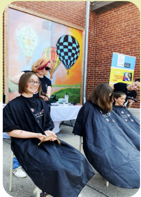
Défi têtes rasées Leucan