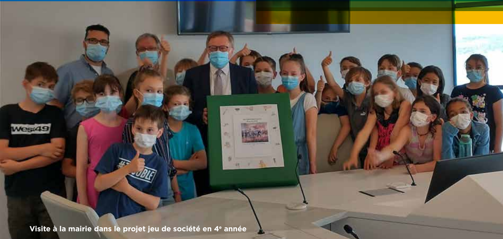
Visite à la mairie dans le projet jeu de société en 4 e année