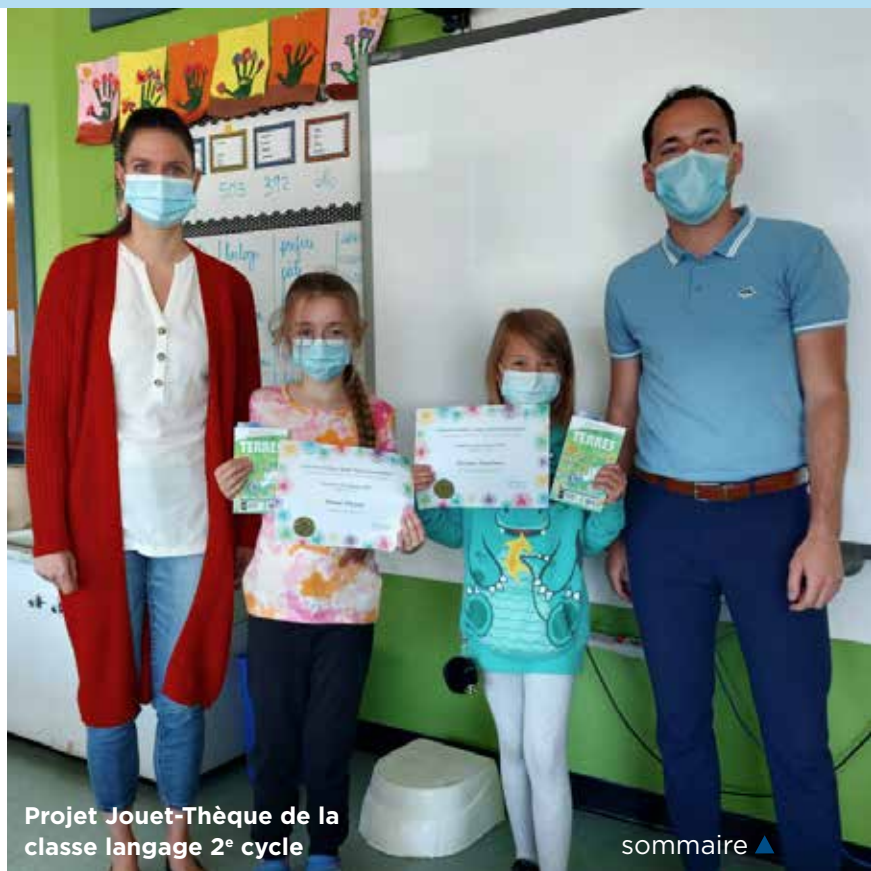
Projet Jouet-Thèque de la classe langage 2 e cycle

* Le contexte de la pandémie a limité la tenue de certaines de nos activités.