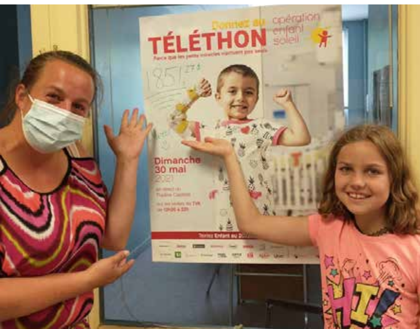
Journée pyjama au profit d'Opération Enfant Soleil