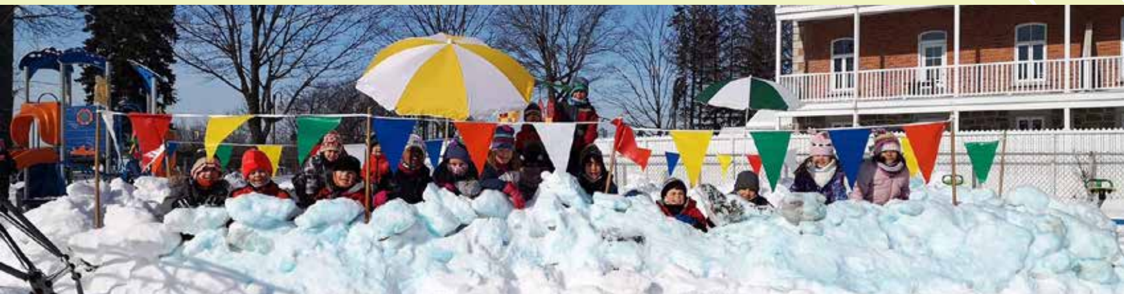
Construction de forts à Notre-Dame-d'Etchemin

Centre de services scolaire des Navigateurs