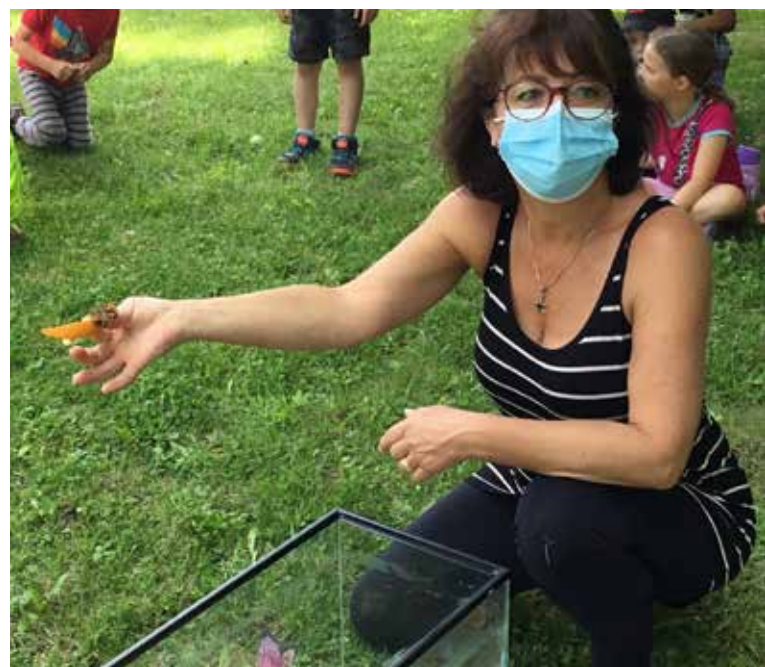
Envolée de papillons au 1 er cycle