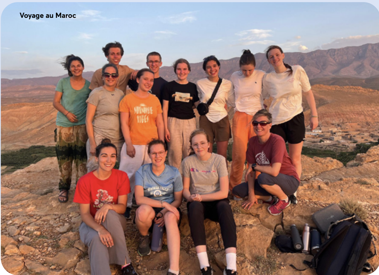
Voyage au Maroc