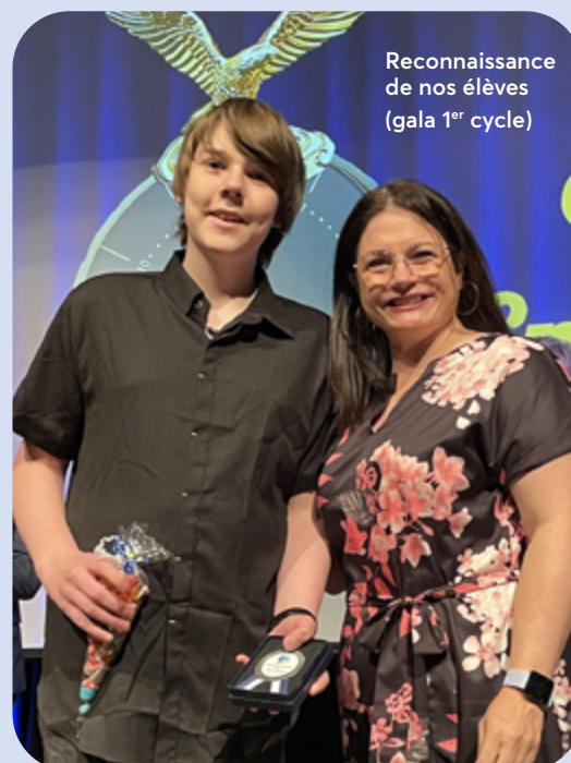
Reconnaissance de nos élèves (gala 1 er cycle)