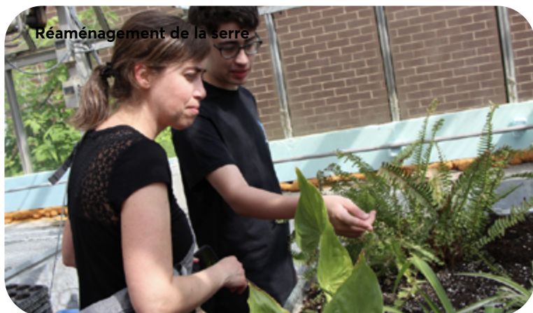
Réaménagement de la serre