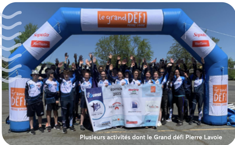
Plusieurs activités dont le Grand défi Pierre Lavoie