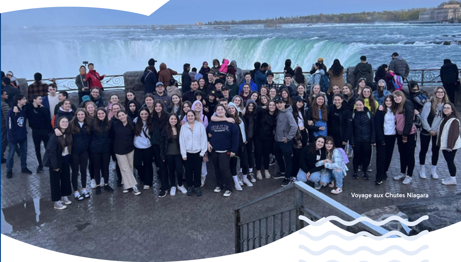
Voyage aux Chutes Niagara