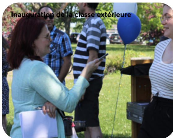
Inauguration de la classe extérieure