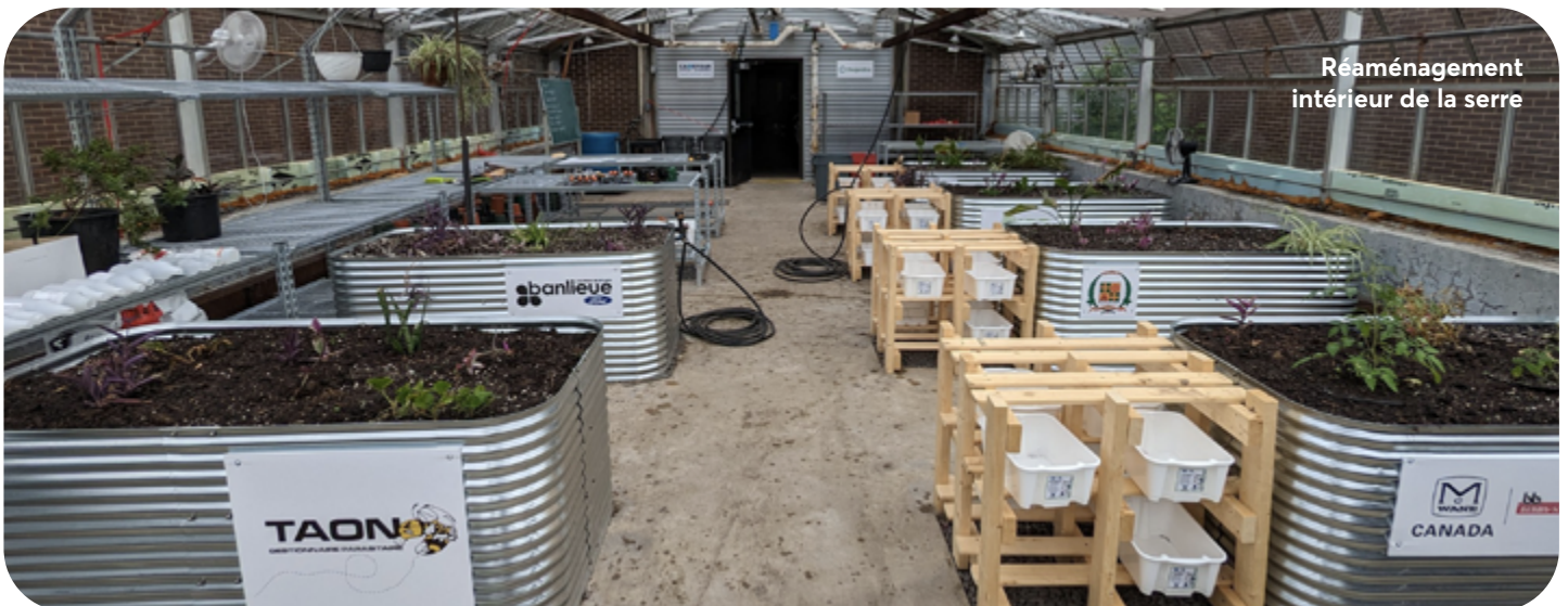
Réaménagement intérieur de la serre