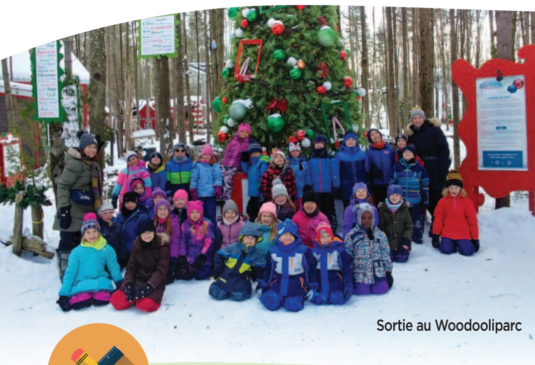
Sortie au Woodooliparc

En raison de l'arrêt des services éducatifs et de l'enseignement causé par l'état d'urgence sanitaire lié à la pandémie de la COVID-19, le ministère de l'Éducation et de l'Enseignement supérieur a modifié le régime pédagogique. Cette modification entraîne un changement dans la communication de la progression et du rendement des élèves au bulletin unique. De ce fait, les résultats produits à l'étape 3 et au sommaire sont communiqués en mention (Réussi, Non Réussi ou Non Évalué) alors qu'aux étapes 1 et 2 l'atteinte des attentes du programme est communiquée en pourcentage. Les résultats de l'année scolaire 2019-2020 ne pourront faire l'objet d'analyse ou de comparaison, étant donné les conditions entourant cette situation à caractère exceptionnel.