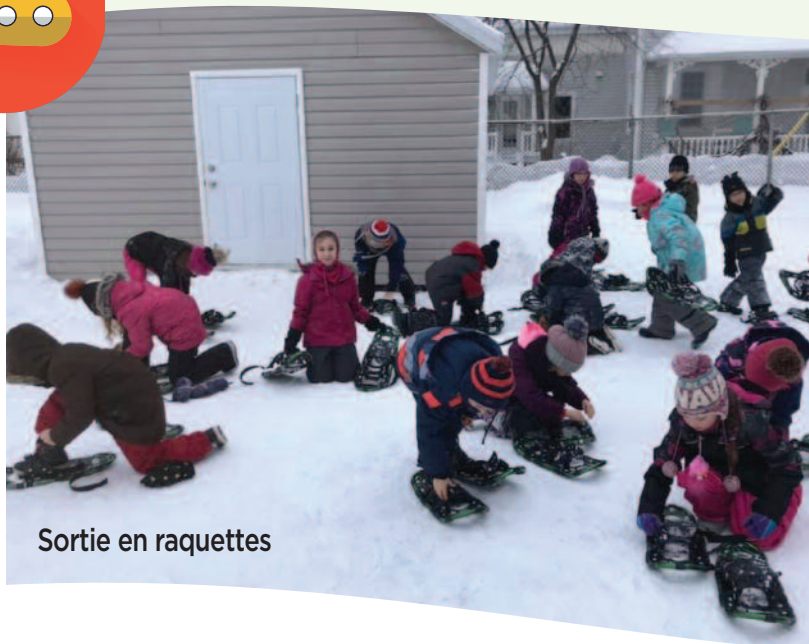
Sortie en raquettes