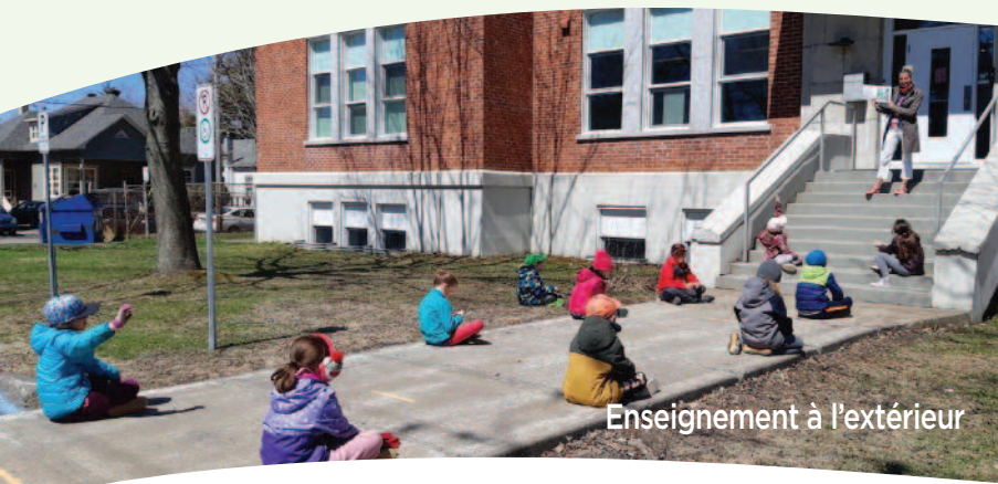
Enseignement à l'extérieur