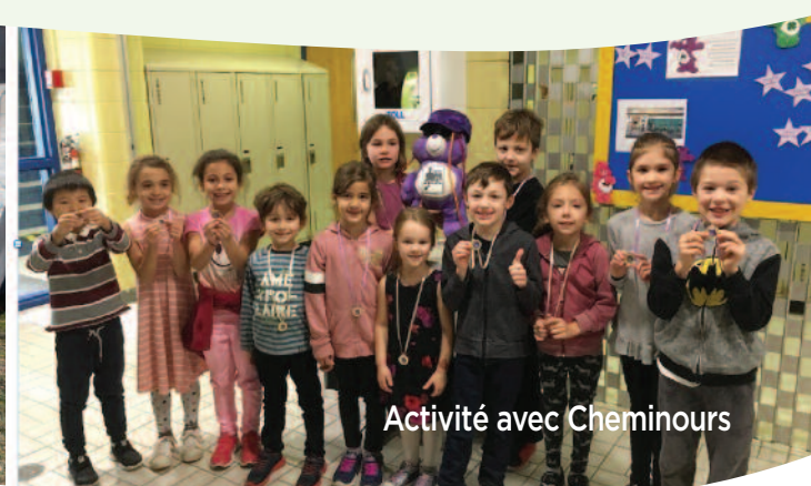
Activité avec Cheminours