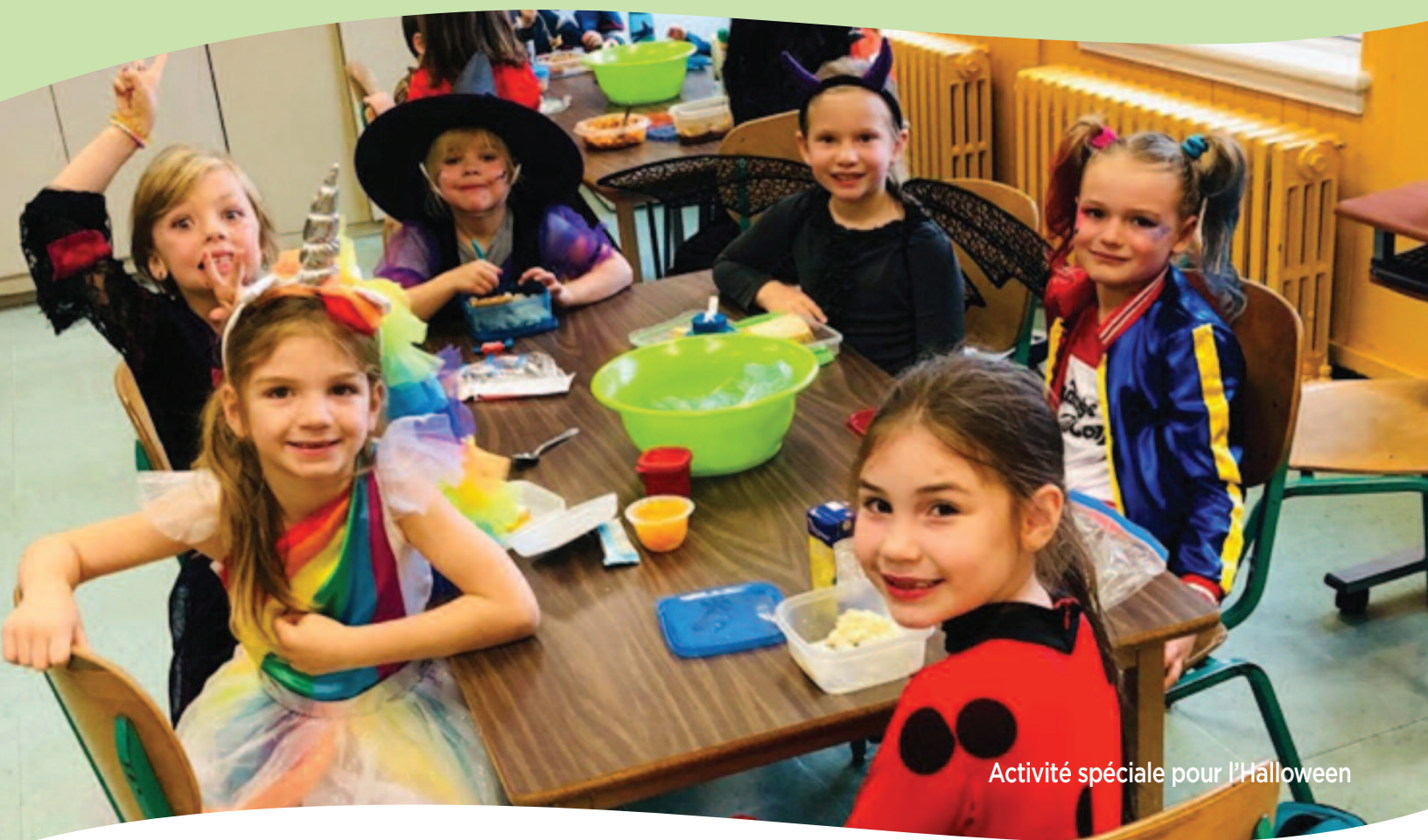
Activité spéciale pour l'Halloween