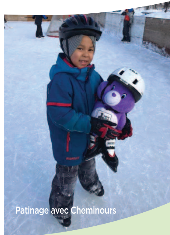
Patinage avec Cheminours