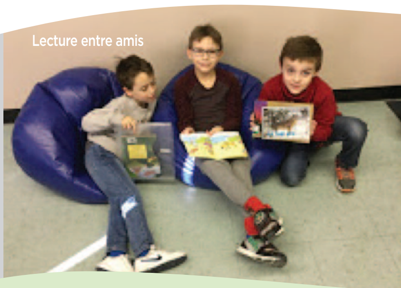
Lecture entre amis