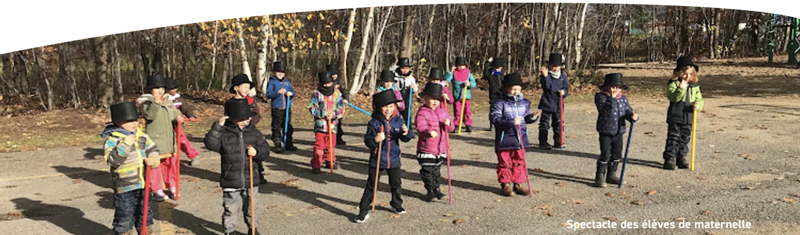
Spectacle des élèves de maternelle