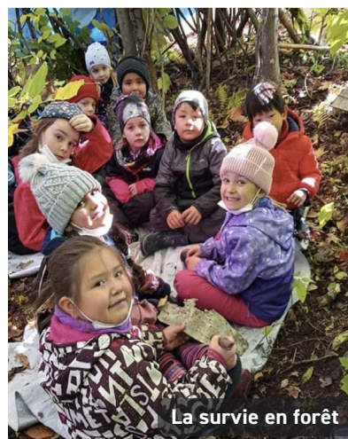
La survie en forêt