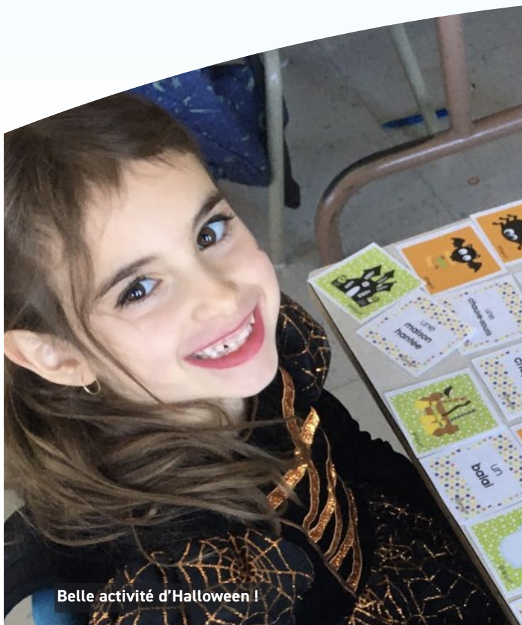
Belle activité d'Halloween !

Le départ de nos élèves de deuxième année vers leur nouvelle école est également pris en charge. Une collaboration avec l'école d'accueil est mise en place afin de favoriser une transition harmonieuse. C'est la même chose pour les élèves qui nous quittent en classe langage.