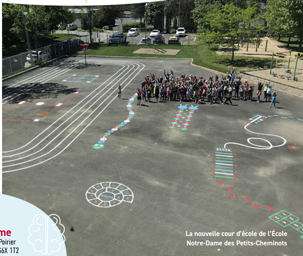
La nouvelle cour d'école de l'École Notre-Dame des Petits-Cheminots