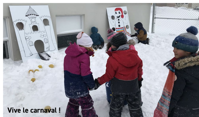
Vive le carnaval !

Notre projet éducatif et nos rencontres collaboratives (CAP) mettent de l'avant la lecture. Plusieurs projets et moyens sont mis en place pour assurer la réussite de tous les élèves. Un dépistage en fluidité est réalisé entre deux et trois fois par année permettant ainsi d'offrir rapidement un coup de pouce aux élèves fragiles. Des projets et des routines littéraires visant à améliorer cette compétence sont également mis en place dans les classes afin de prévenir les difficultés. Brutus et Fabio, nos experts en stratégies de compréhension de lecture et de résolution de problèmes sont présentés dans les classes du premier cycle afin d'harmoniser nos pratiques et de se doter de stratégies communes et signifiantes pour les élèves. Du temps de plus en psychoéducation a permis la bonification du rôle-conseil auprès des membres du personnel (enseignants, éducatrices spécialisées et éducatrices du service de garde), un suivi personnalisé pour quelques élèves et une communication plus régulière avec nos partenaires.