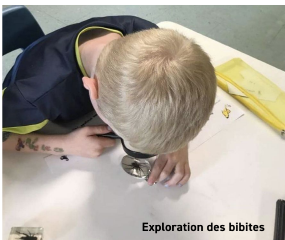
Exploration des bibites