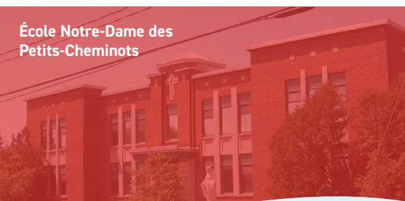
École Notre-Dame des Petits-Cheminots