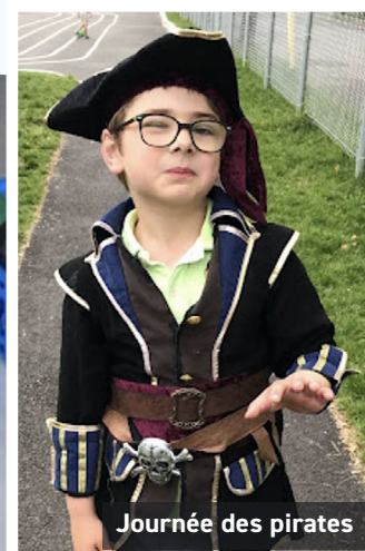
Journée des pirates