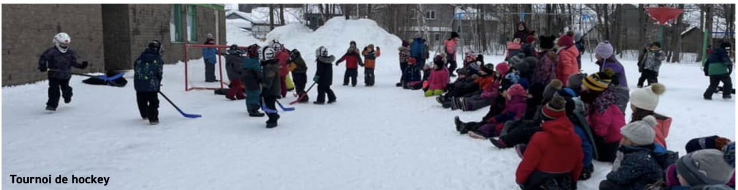
Tournoi de hockey