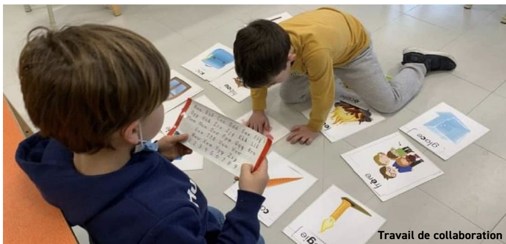
Travail de collaboration