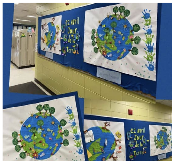
Célébration du Jour de la Terre