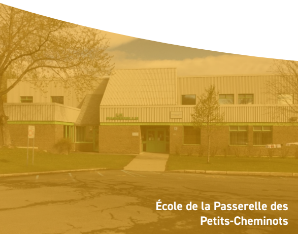
École de la Passerelle des Petits-Cheminots