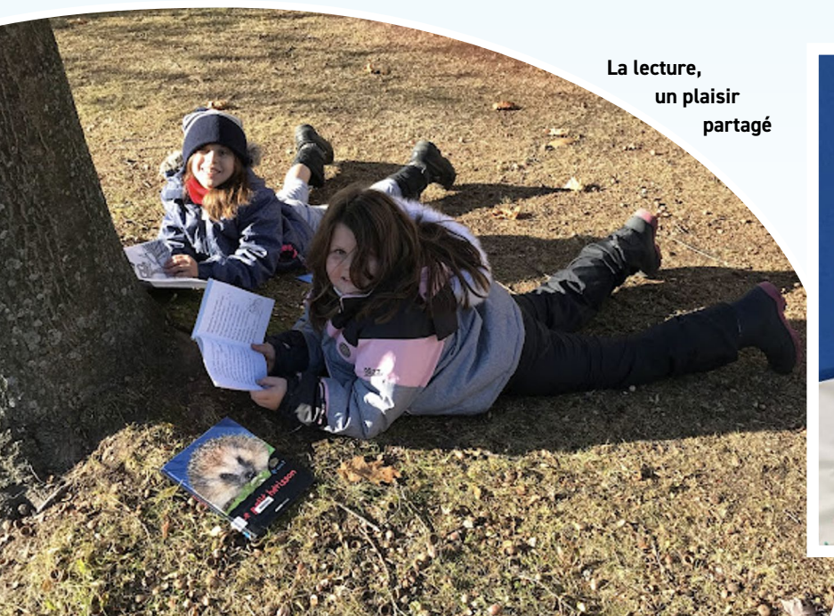
La lecture, un plaisir partagé

Page Facebook : facebook.com/petitscheminots