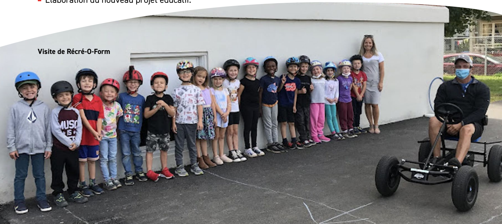
Visite de Récré-O-Form