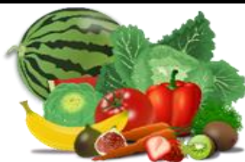
Fruits et légumes

Attention! En raison des cas d'allergies, toutes les collations contenant (ou pouvant contenir) des noix ou des arachides sont strictement interdites.