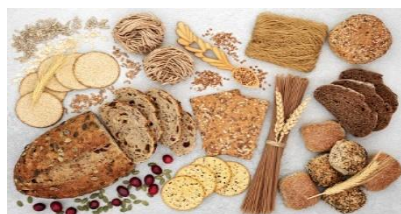
Aliments de grains entiers