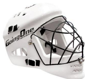
Casques de hockey