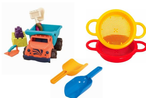
Jouets de sable