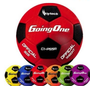
Ballons de soccer