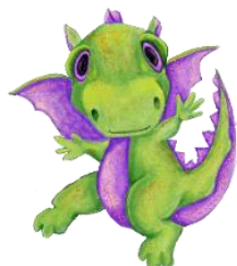
Surprises pour le pique-nique