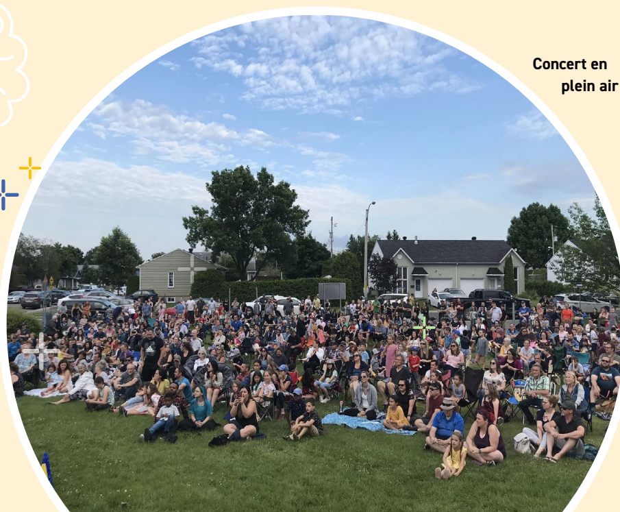
Concert en plein air