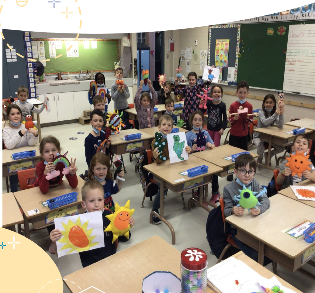
Des activités stimulantes