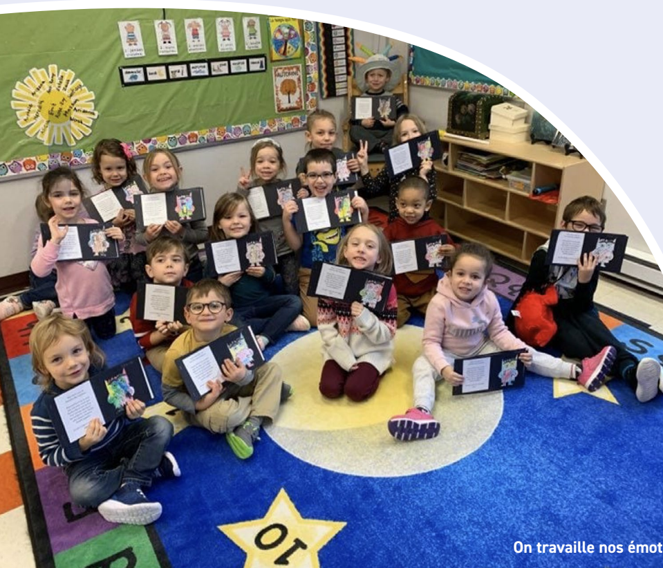
On travaille nos émotions

Collaboration : Je participe activement au travail d'équipe en misant sur les forces de chacun dans le but de réaliser un projet commun.