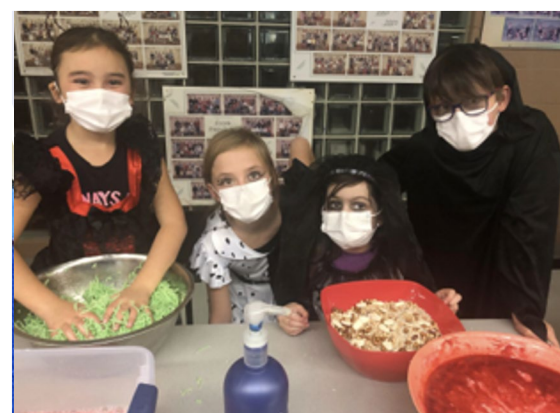
Les activités de classe et celles du service de garde