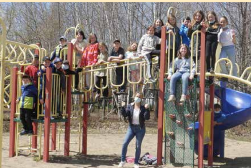
Des activités rassembleuses

Collaboration : Je participe activement au travail d'équipe en misant sur les forces de chacun dans le but de réaliser un projet commun.