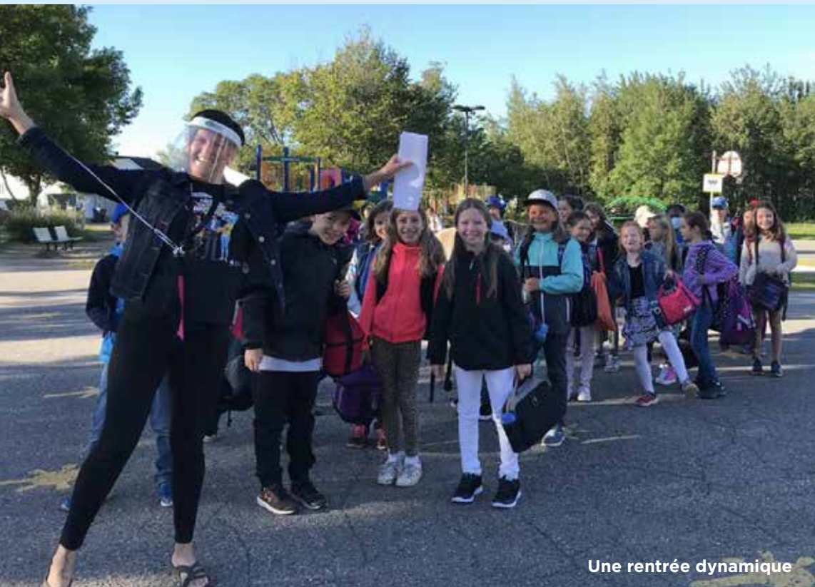
Une rentrée dynamique

répartis dans 13 groupes de la maternelle à la 4 e année.