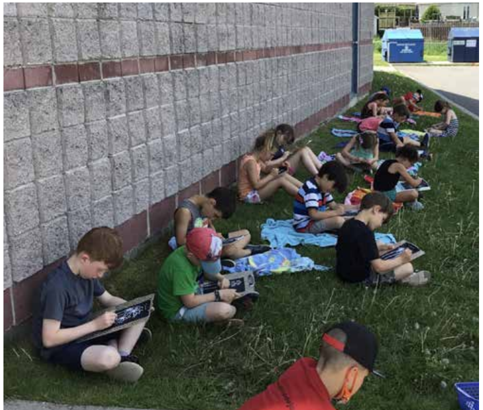
Lecture à l'extérieur