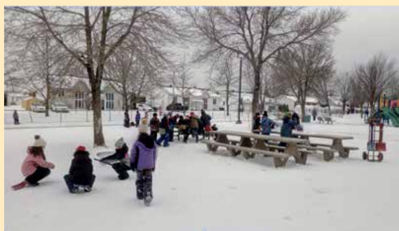
Un service de garde extraordinaire