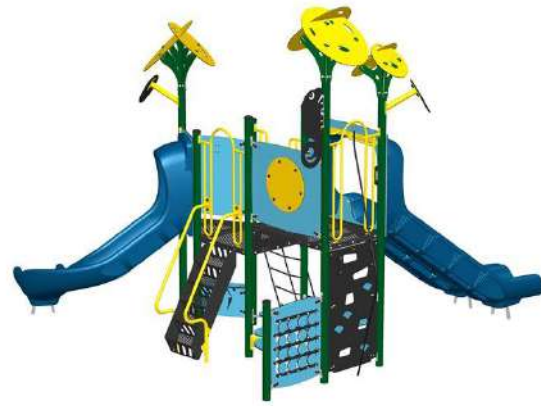
TRACTOPELLE / TOURNIQUET/ BARRES LATÉRALES