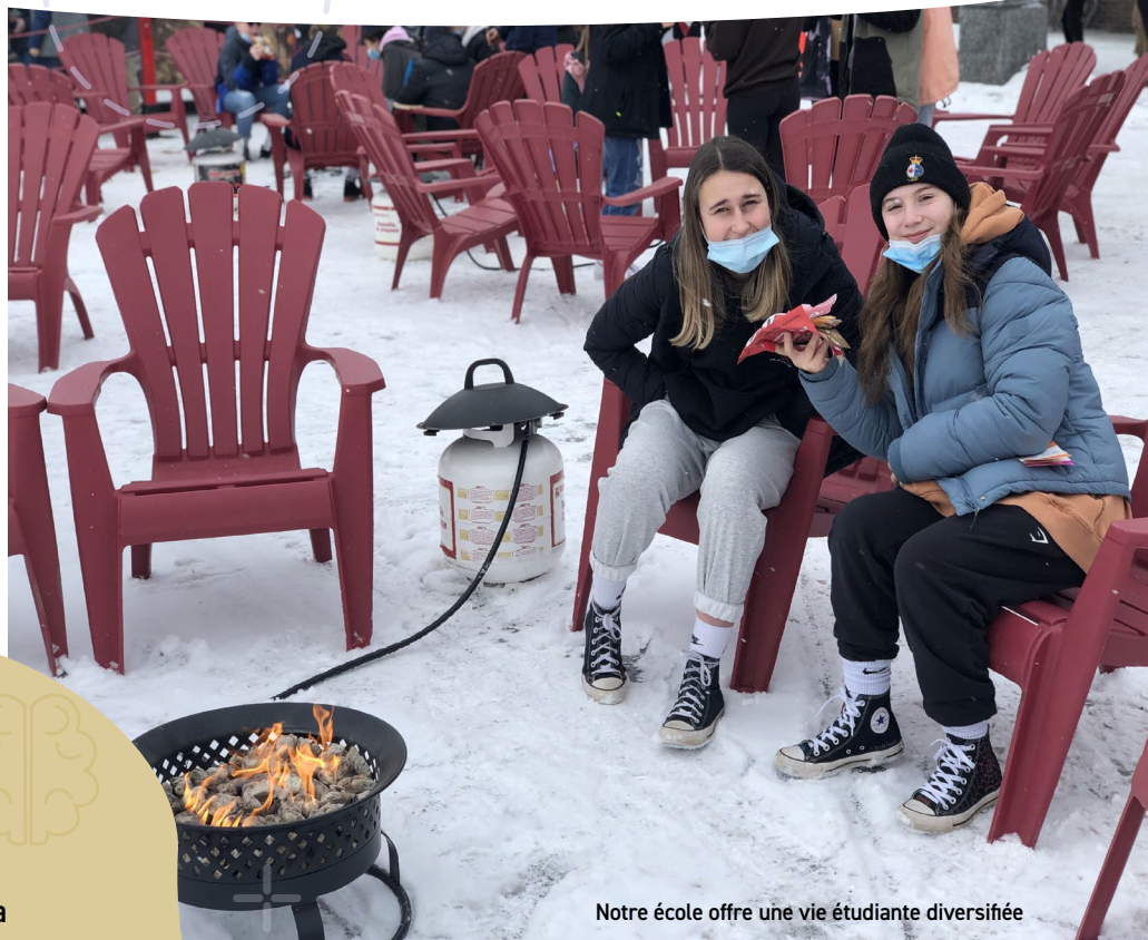
Notre école offre une vie étudiante diversifiée