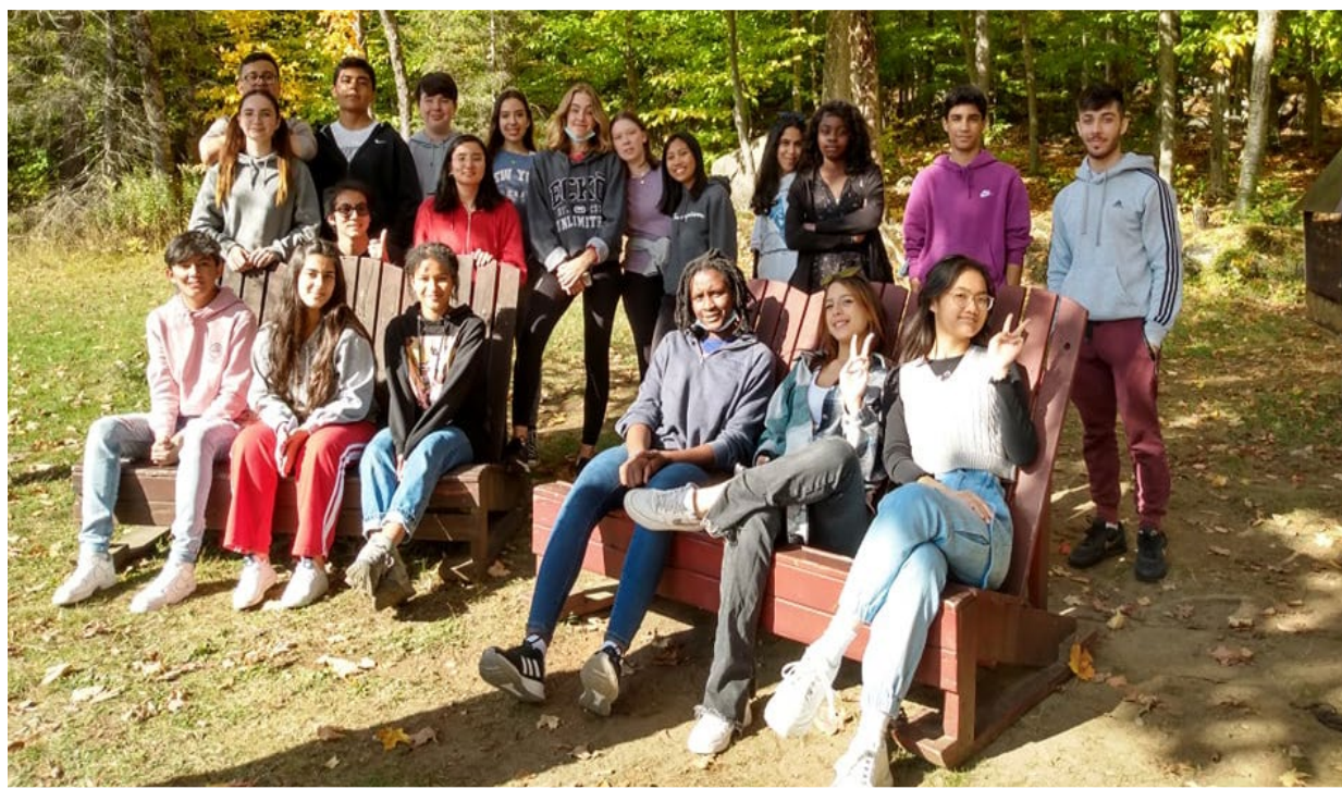
Plusieurs activités sont offertes pour nos élèves issus de l'immigration

Pour l'année 2022-2023, nous devons affronter le grand défi de l'augmentation de la clientèle conjugué à la difficulté de recrutement de la main-d'œuvre. Toutefois, nous avons eu un début d'année des plus positifs avec un retour de tous les élèves en présence à temps complet et un début d'année sous le signe de la normalité. Nous allons poursuivre l'accompagnement de nos jeunes dans l'objectif de réduire au maximum le décrochage scolaire et permettre à tous nos élèves de tracer leur chemin.