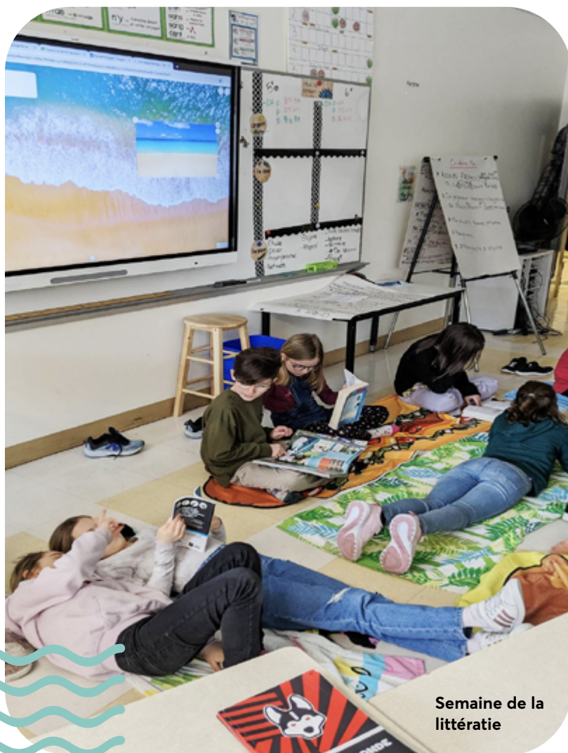
Semaine de la littératie