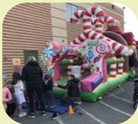
Super fête pour les futurs élèves du préscolaire 5 ans