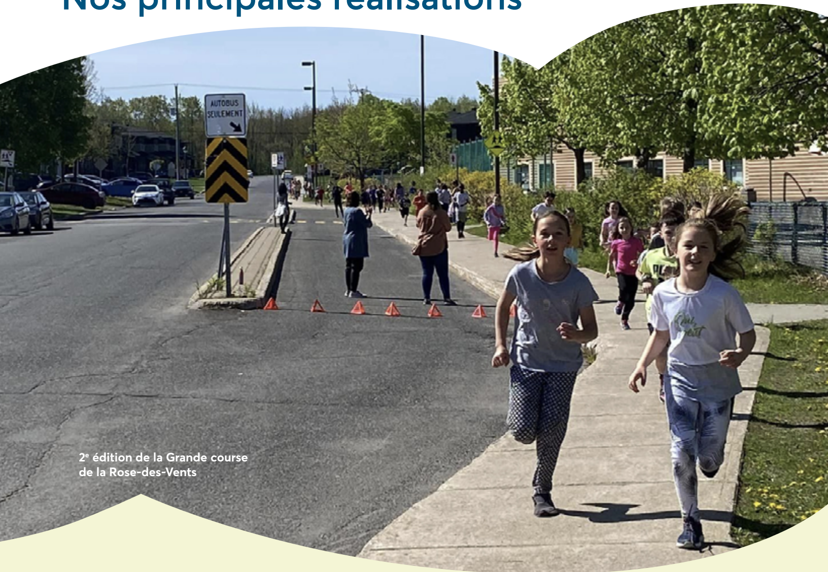
2 e édition de la Grande course de la Rose-des-Vents