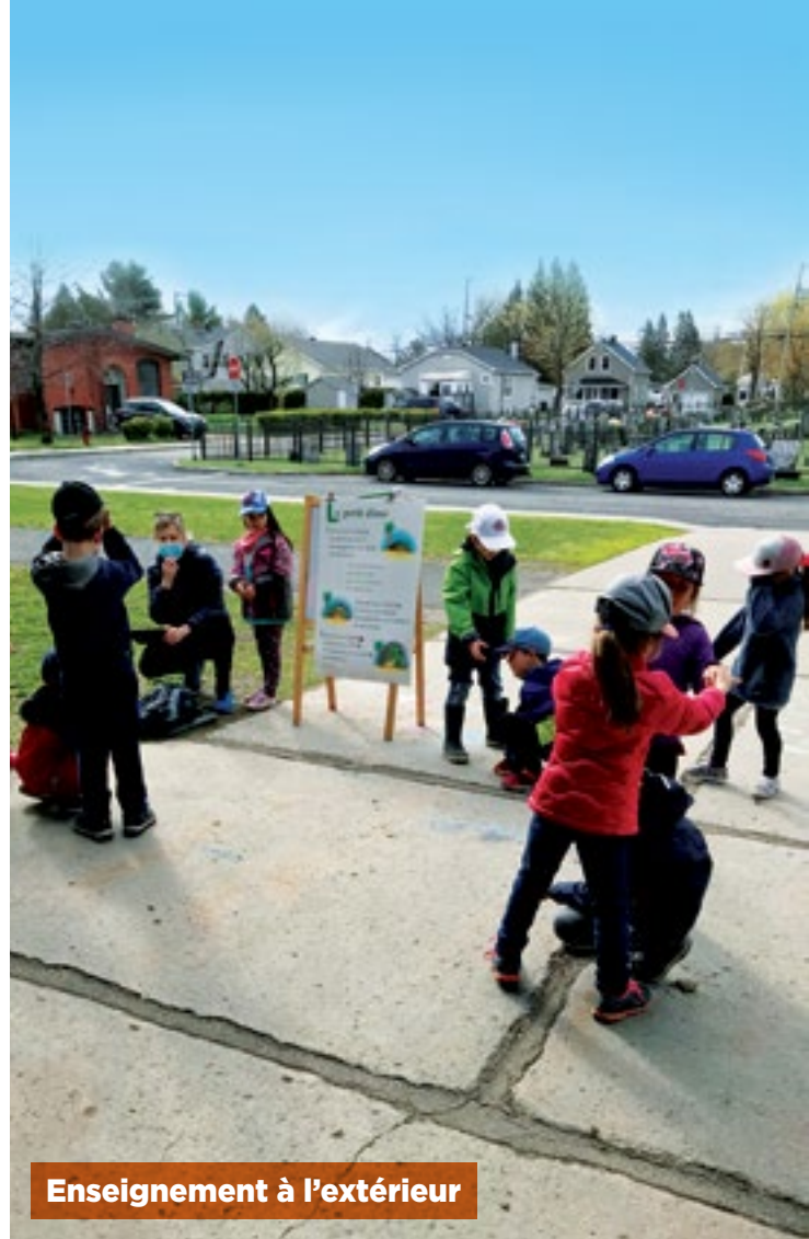
Enseignement à l'extérieur

Depuis les six dernières années, nous avons instauré une nouvelle approche qui assure la mise en place d'actions concrètes visant à soutenir le développement psychomoteur des enfants du préscolaire. Par l'entremise de l'approche « Actif au quotidien », nous sommes en mesure d'intégrer sur une base plus régulière des activités visant à favoriser le développement global de l'enfant, et ce, quotidiennement. Cette responsabilité est partagée avec tous les intervenants qui gravitent autour de l'élève soit, l'enseignante du préscolaire, l'éducateur physique et l'éducateur du service de garde.