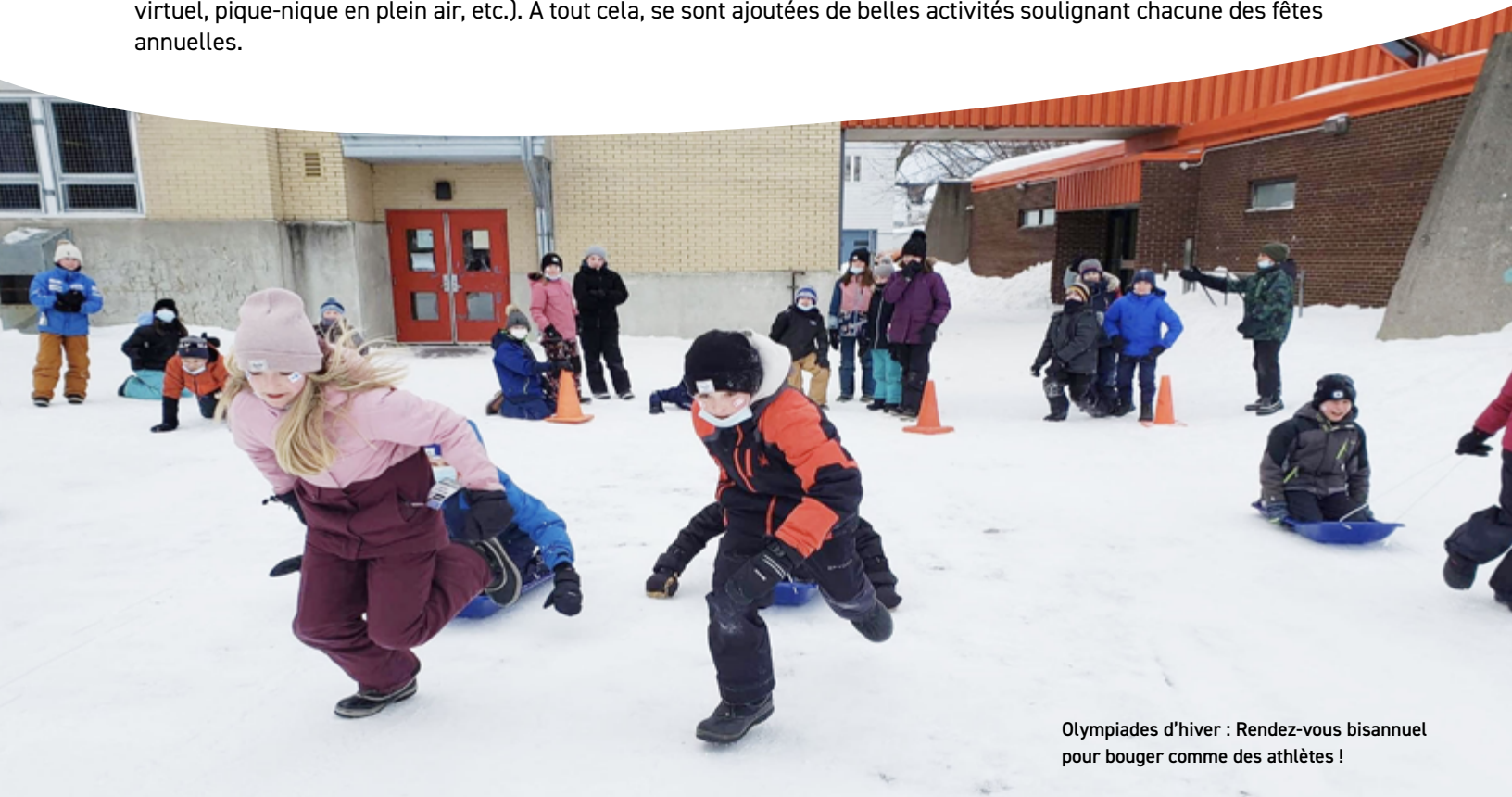
Olympiades d'hiver : Rendez-vous bisannuel pour bouger comme des athlètes !