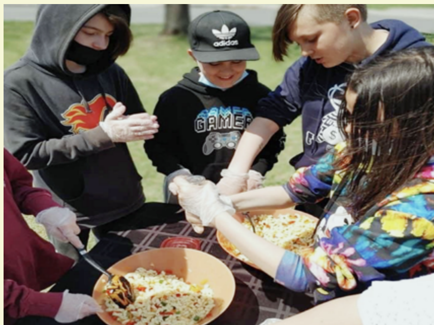
Projet communautaire : cuisiner pour le frigo collectif du quartier Saint-Joseph !