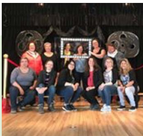
La Semaine des services de garde sous le thème : « La garde scolaire s'affiche ! »

Les valeurs priorisées par l'équipe de l'École Saint-Joseph sont la bienveillance, l'épanouissement, la persévérance et la responsabilisation.