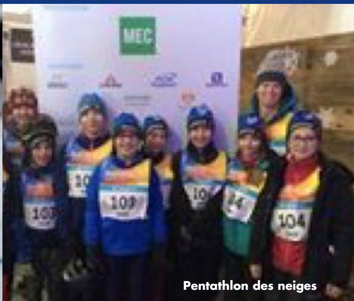
Pentathlon des neiges