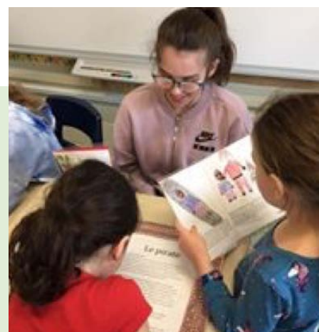
Le salon de l'auteur