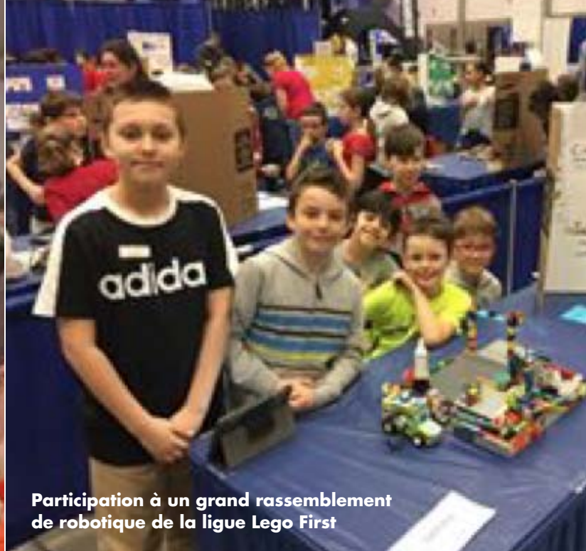
Participation à un grand rassemblement de robotique de la ligue Lego First