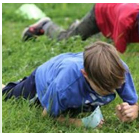
L'ascension du mont Lauzon