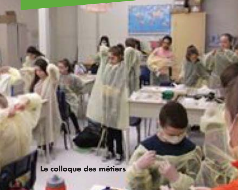
Le colloque des métiers