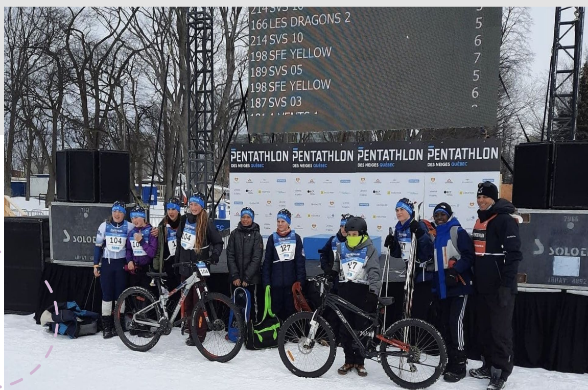
Pentathlon des neiges