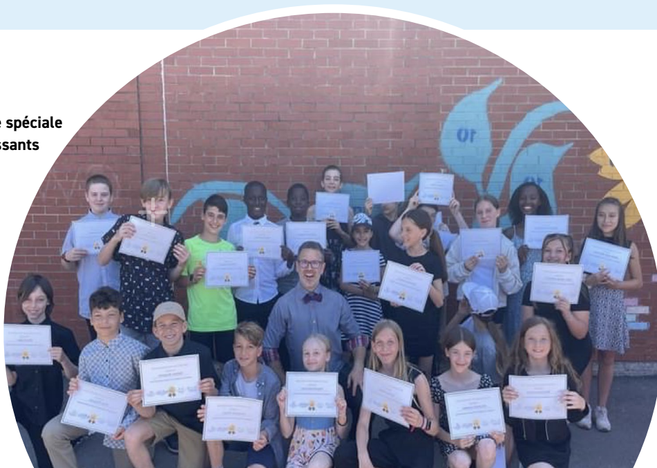
Journée spéciale des finissants

■ Trousse des apprentissages sociaux et émotionnels : Poursuivre l'utilisation des trousse des apprentissages sociaux et émotionnels auprès des élèves. Des ateliers en sous-groupes seront animés afin de soutenir les élèves ciblés.