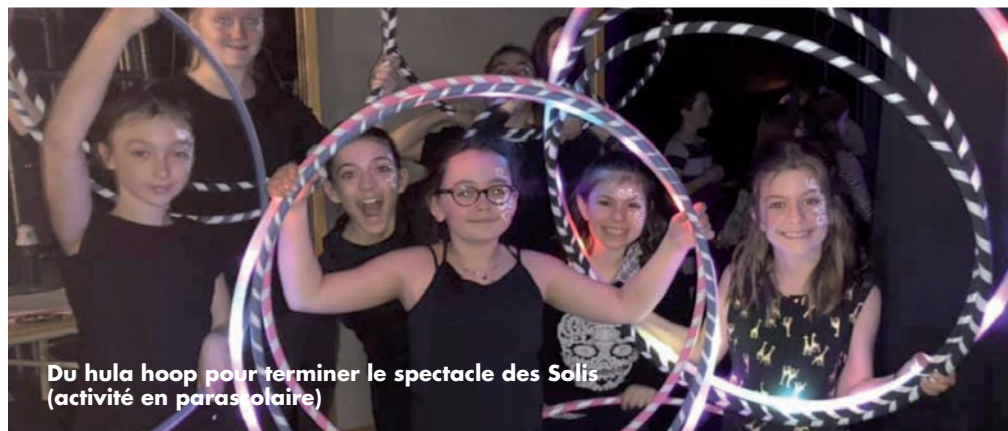
Du hula hoop pour terminer le spectacle des Solis (activité en parasolaire)