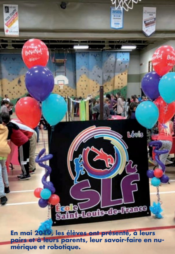
En mai 2019, les élèves ont présenté, à leurs pairs et à leurs parents, leur savoir-faire en numérique et robotique.