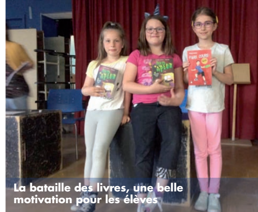
La bataille des livres, une belle motivation pour les élèves