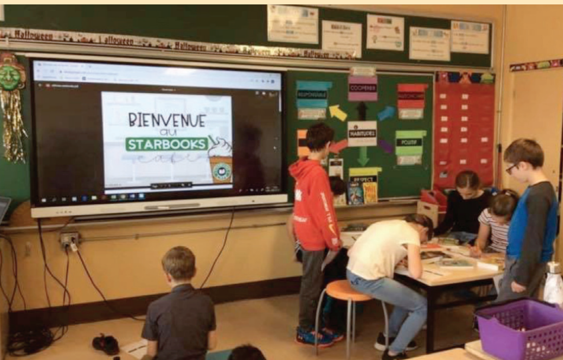
Projet de littérature en 5 e année pour découvrir les différents styles littéraires.