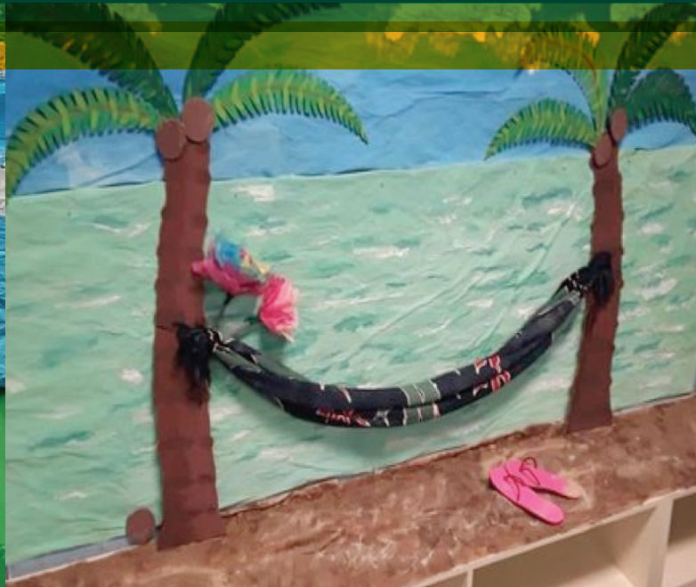
Journée sous le thème du soleil et de la plage lors de l'ouverture du Service de garde d'urgence.