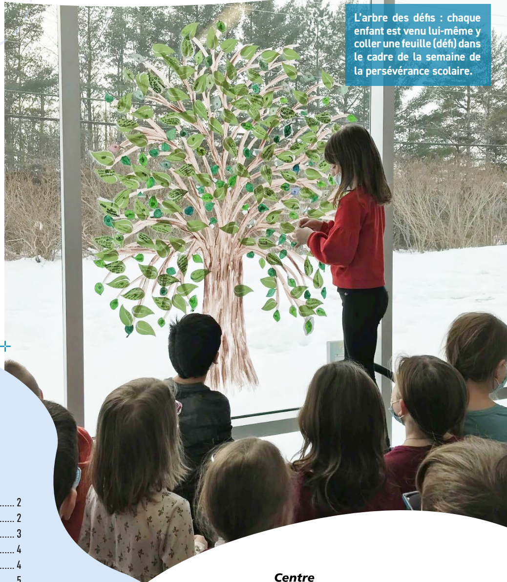
L'arbre des défis : chaque enfant est venu lui-même y coller une feuille (défi) dans le cadre de la semaine de la persévérance scolaire.