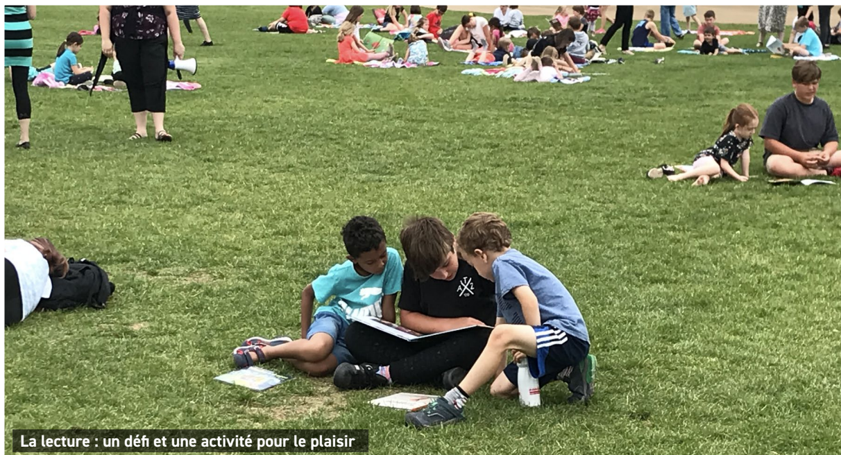
La lecture : un défi et une activité pour le plaisir