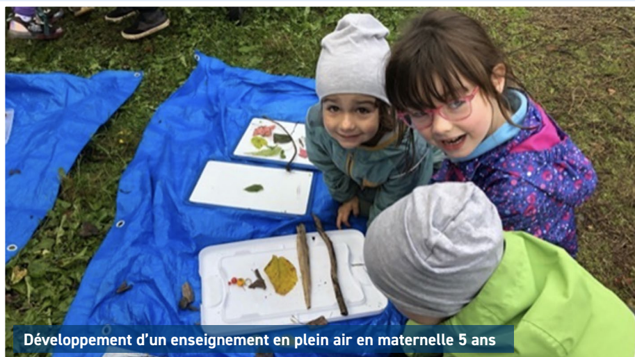
Développement d'un enseignement en plein air en maternelle 5 ans