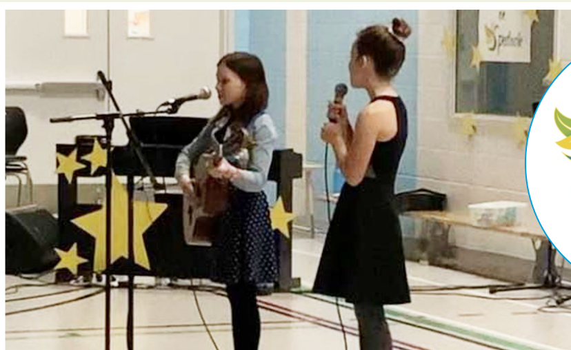
1 re édition de Sentiers en spectacle