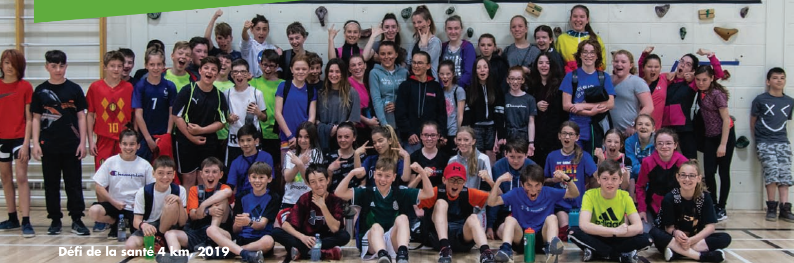
Défi de la santé 4 km, 2019