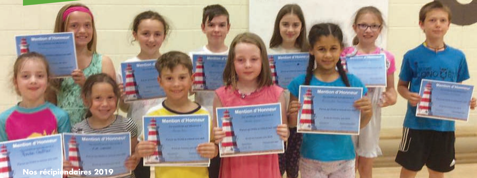
Nos récipiendaires 2019